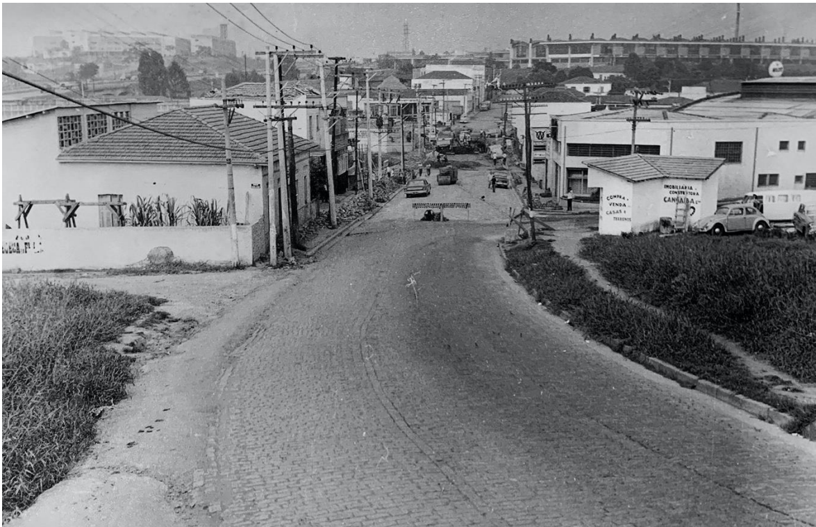
Figure 1. Avenida Guarulhos, Vila Augusta com a Olivetti no fundo a direita, 1960 - Arquivo Histórico Municipal Araci Borges Dias Martins, Guarulhos. Tombo-100

Adriano Olivetti desenvolveu o conceito de Comunità enquanto trabalhava no plano regional da Valle d'Aosta, quando em meados dos anos Trinta ele viu o planeamento urbano como uma ciência racional capaz de organizar corporativamente a sociedade e a economia. Na década seguinte aprofundou o valor personalista da Comunità e suprimiu definitivamente os sotaques corporativistas, tecnocráticos e excessivamente racionalistas que tinham caracterizado a concepção anterior de urbanismo.