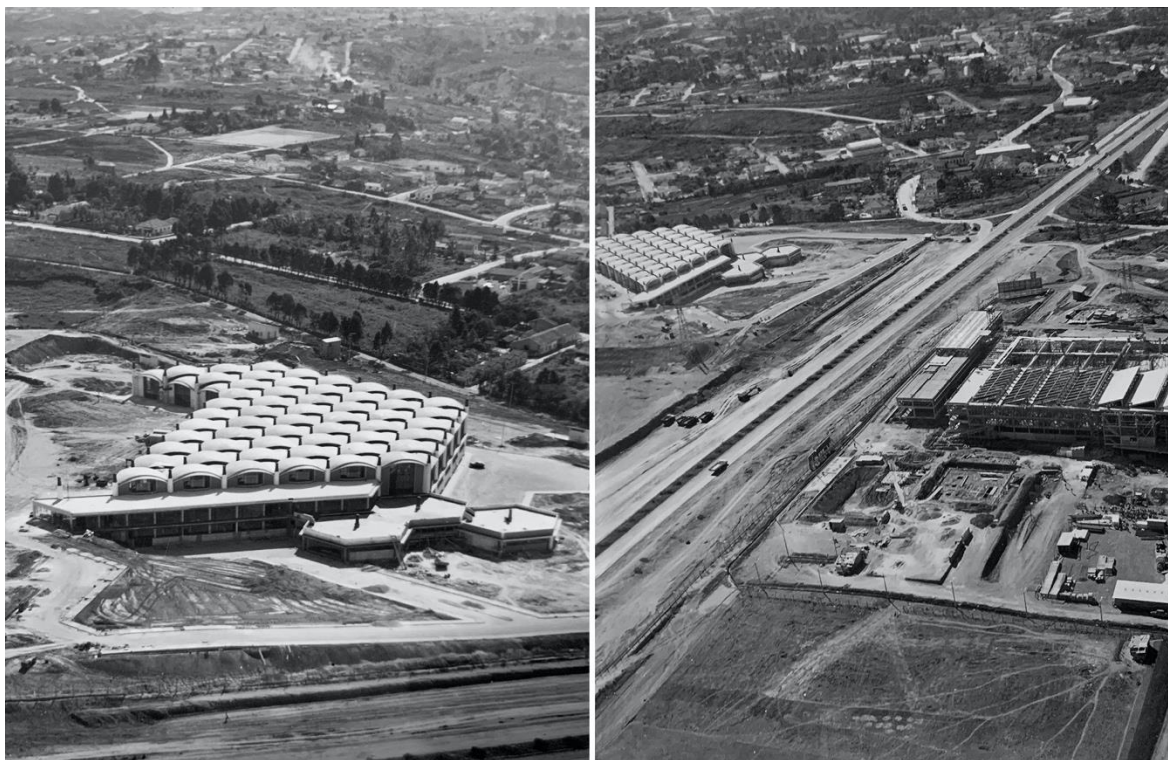
Figure 2. Fábrica da Olivetti em construção. Foto aérea, 1959 - Fotografia de Masami Kishi, Arquivo Histórico Municipal Araci Borges Dias Martins, Guarulhos. Tombo-3009

A fábrica foi construída em duas fases com um processo que durou de 1956 a 1963 e a execução dos trabalhos confiados para a primeira fase à empresa Carabelli & Cecchi Eng. e Constr. Ltda e para a segunda fase para a empresa Edibras Construções Gerais Ltda. O projecto da Olivetti