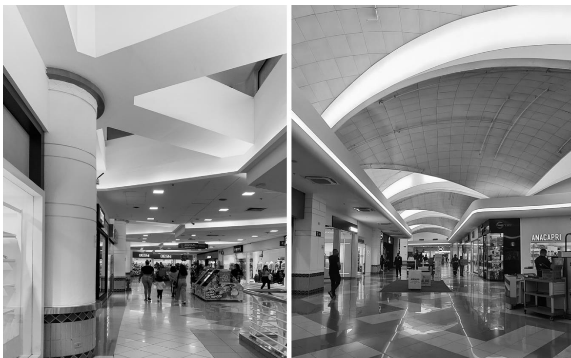
Figure 5. - Foto do interior do Internacional Shopping Guarulhos, na parte que era destinada à linha de montagem. O pilar original é visível e revestido de decorações, 2022

As intenções composicionais originais da Zanuso de construir edifícios discretos e integrados na paisagem perderam-se com a construção do centro comercial, o que tem um impacto volumétrico significativo na conformação urbana dos arredores. O distrito, outrora predominantemente industrial, é agora caracterizado por edifícios residenciais. Estas mudanças foram vistas como positivas e tiveram origem no projecto de conversão da antiga fábrica da Olivetti, resultando em novos investimentos na área. A influência do International Shopping tem sido comparada à do vizinho Aeroporto Internacional de São Paulo/Guarulhos, o que trouxe novos ganhos económicos e, no caso do centro comercial, levou a um boom imobiliário que viu o valor das propriedades circundantes aumentar.