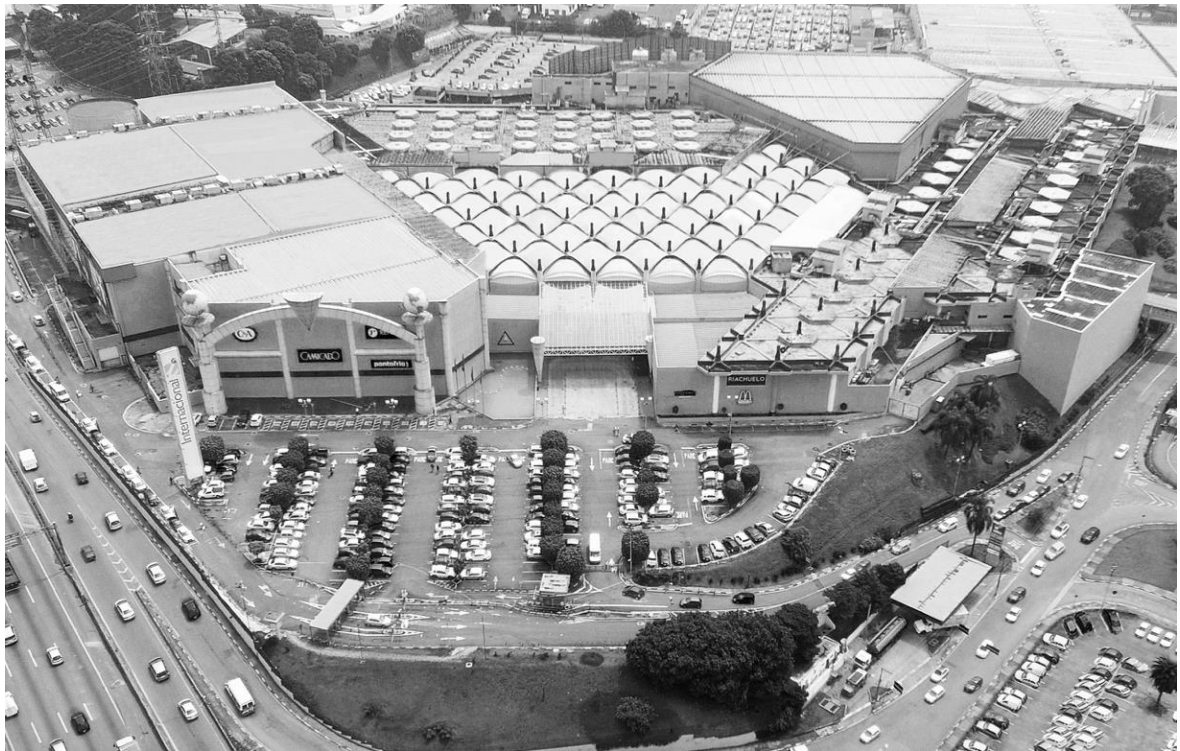
Figure 4. - Foto aérea do Internacional Shopping Guarulhos, resultado da transformação da fábrica Olivetti, 2017