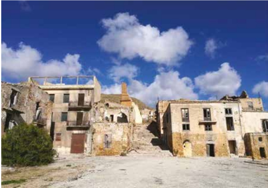
Fig. 5 Ruderi di Poggioreale. Fontaine Largo Cannoli. Auteur: Nadia Frullo.

le Plan de paysage 17 comme “Centre, noyau historique, paysage urbain de valeur” caractérisé par des objectifs de protection et de mise en valeur en tant que patrimoine archéologique et nœud principal appartenant à un système culturel reconnu comme un objet identitaire complexe de protection du paysage. En particulier, la protection en tant que zone archéologique détermine la possibilité de réalisation et de valorisation également à travers l’inclusion dans des itinéraires culturels et des circuits muséaux capables de communiquer et de transmettre les caractères de l’histoire et de la mémoire liés à l’identité de la communauté du Belice.