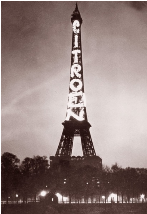
1: La Tour Eiffel illuminata con la pubblicità Citroën, 1925 ca. s.a.

Certo, già a partire dall'ultimo scorcio del XIX secolo, le città occidentali avevano visto un proliferare di totem, supporti e insegne, la cui evoluzione, dal punto di vista grafico è nota [Pope 1983]. I manifesti, terreno di sperimentazione per gli artisti post-impressionisti, popolano le strade, prima come quadri appesi alle pareti, in modo un po' casuale, poi ricoprono le altrimenti nude superfici dei nuovi edifici urbani – stazioni ferroviarie, mercati coperti, esiti incerti di dubbia pianificazione come muri ciechi – per essere in seguito posizionati su supporti appositi [Fili 2015], come normato da Alphand nel suo testo – prescrittivo – sull'arredo urbano della Parigi haussmaniana [Alphand 1867-1873]. Le affissioni diventano allo stesso tempo fonte di gettiti per le casse comunali e sono sempre più soggette a burocrazie, regolamenti, tassazioni e flussi di denaro [Facchetti 2011]. Gli affiche trovano così spazio sulle apposite colonne , ma anche sugli orinatoi o i lampioni stradali, come dire che ogni pretesto è buono per diffondere il verbo della pubblicità che tanto spaventa Marcuse.