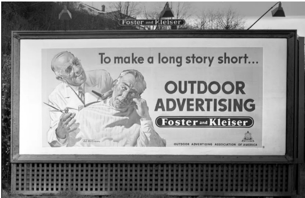
3: Manifesto stradale per la pubblicità dell'agenzia Foster & Kiesler, anni Quaranta.