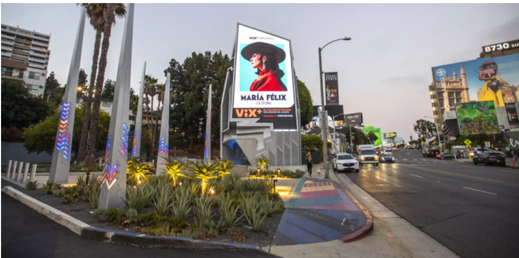
4: Tom Wiscombe Architecture, Billboard interattivo, Los Angeles, 2022

Come dire né con, né senza. L'apparato del linguaggio pubblicitario urbano, che oggi include anche strumenti meno appariscenti e più sofisticati come l'internet delle cose, le whisper windows ecc. [Filippini 2022], è ancora un nervo scoperto, sul cui dibattito convergono approcci molto distanti tra loro: la difesa della proprietà individuale – il campo visivo “privato” – e, agli antipodi, quella della sensibilità collettiva e del decoro urbano.