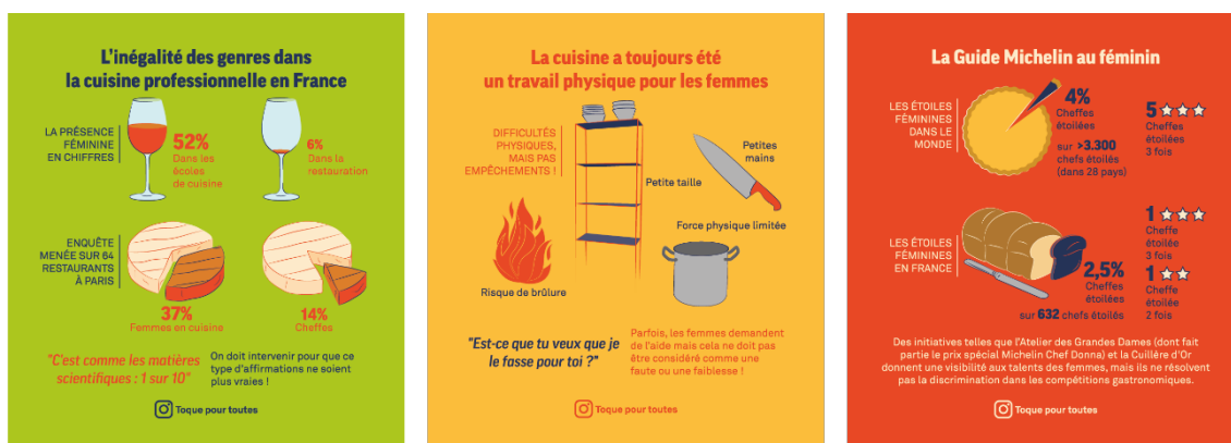
Fig. 7: Retro di alcuni flyer, riportanti i dati raccolti con la ricerca

Infine, una pagina Instagram dedicata (fig. 8) è stata pensata come mezzo di promozione e diffusione del progetto presso un pubblico ampio, al fine di sollecitare la riflessione e di attivare ulteriori confronti e fare network con analoghi progetti di sensibilizzazione.