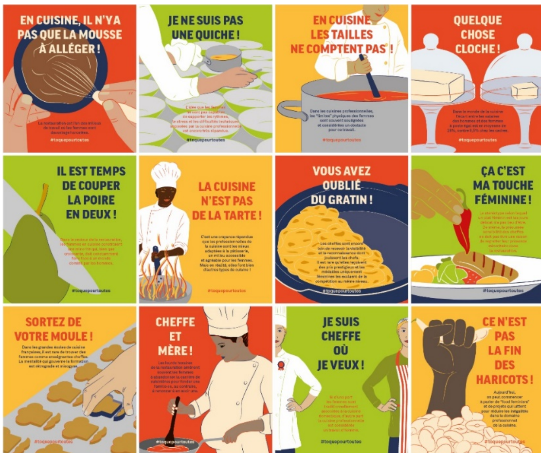
Fig. 3: I dodici manifesti, cuore del progetto

Le frasi sono riprese per caratterizzare portatovaglioli e sottobicchieri utilizzabili presso i ristoranti (fig. 4 e 5).