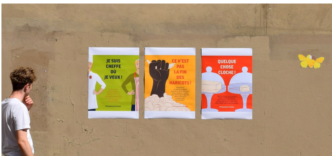
Fig. 9: Esempio di manifesti nel contesto d'uso

Il lavoro condotto rivela la possibilità del Design della comunicazione di favorire l'emergere di consapevolezza e processi di trasformazione sociale grazie all'adozione di canali di diffusione efficaci, di modalità comunicative attraenti e di strumenti agili, adeguati al contesto di intervento e alla tematica affrontata, quali un linguaggio arguto, sintetico e facilmente accessibile. Il designer può quindi mettere in gioco le proprie competenze per far luce su temi cruciali ed evidenziare quando ce n'est pas la fin des haricots! 2