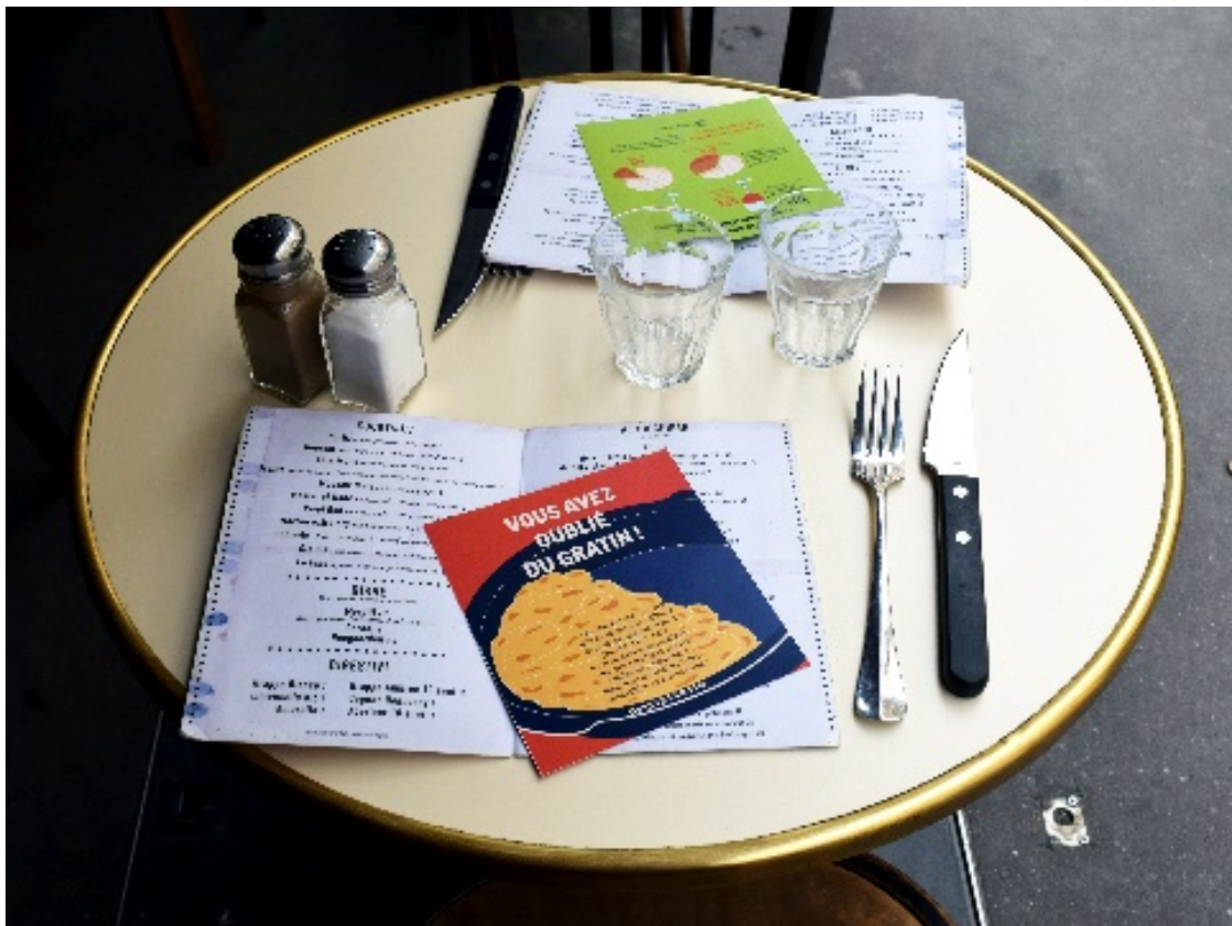
Fig. 6: Esempio di flyer nel contesto d'uso

Gli stessi contenuti, accompagnati dai dati raccolti durante la fase di ricerca, sono riproposti in versione flyer da distribuire durante eventi culinari (fig. 6).