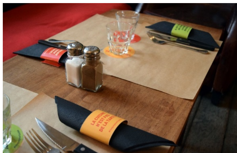
Fig. 1: Portatovaglioli e sottobicchieri riportanti gli slogan e i testi della campagna di sensibilizzazione

Le frasi sono riprese per caratterizzare portatovaglioli e sottobicchieri utilizzabili presso i ristoranti (fig. 4 e 5).