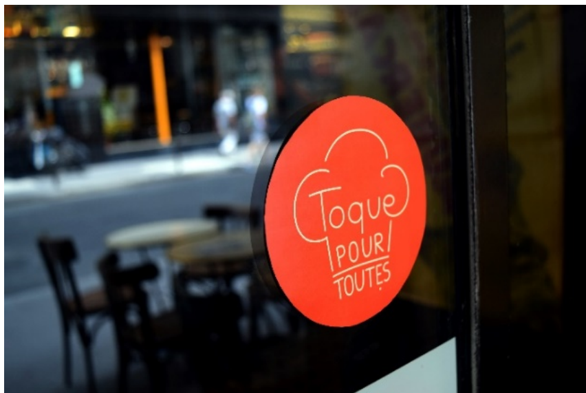
Fig. 1: Sticker riportante il logo del progetto

sconoscimento delle competenze, fino alle molestie fisiche e verbali e agli stereotipi sessisti che le donne subiscono nell'ambiente violento, individualista e gerarchico delle cucine professionali.