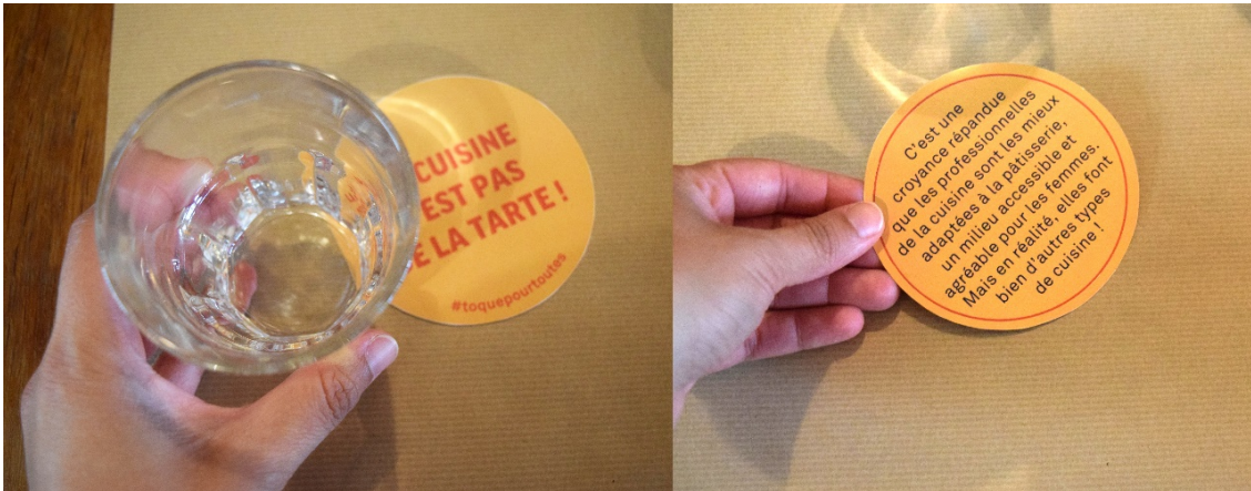
Fig. 2: Fronte e retro di uno dei sottobicchieri realizzati

Gli stessi contenuti, accompagnati dai dati raccolti durante la fase di ricerca, sono riproposti in versione flyer da distribuire durante eventi culinari (fig. 6).