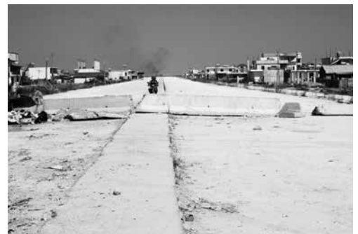
Il collettore principale in attesa di essere tombato