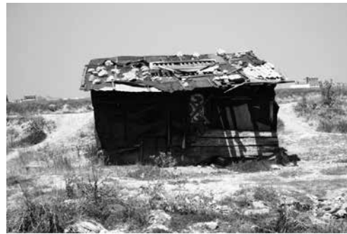
Kolibe, capanne, risalenti ai primi insediamenti e non più utilizzate

Dopo circa vent'anni, nel 2011, si può constatare che nelle abitazioni di Keneta è arrivata l'acqua potabile, non in tutte le zone del quartiere e non a tutte le ore. L'ultima opera di interesse generale, una scuola superiore, l'unica del quartiere, è