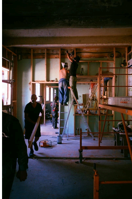
Fig 4. La Place des Possibles, Saint-Laurent-en-Royans, Francia. Un momento del laboratorio di costruzione partecipata organizzato per la ridefinizione degli spazi della "Place des Possibles".

interessi divergenti tra le parti coinvolte portano il progetto a chiudersi e sgretolarsi: l'associazione Les Tracols – che ha acquistato lo spazio sei anni fa per svolgervi il proprio lavoro e catalizzare altre forme di associazionismo e servizi – è strettamente legata all'assistenza sociale, un settore che in Francia riceve consistenti finanziamenti pubblici; progetti culturali e artistici, hanno invece più difficoltà nell'ottenere finanziamenti dal settore pubblico, e questo ha creato una disparità di opportunità e risorse tra i soggetti coinvolti nel processo, contribuendo al fallimento dell'operazione, con la chiusura parziale del progetto a partire dal 2023.