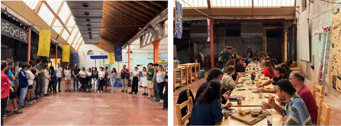
Fig 7-8. La Place des Possibles, Saint-Laurent-en-Royans, Francia. Il progetto ASOC ha l'interesse di creare connessione tra tre scuole di architettura, con progetti di comunità locali in aree marginali e una generazione di architetti-attivisti organizzati in collettivi provenienti da Francia, Italia e Grecia. I pasti collettivi sono un momento di costruzione del team delle tre scuole, i collettivi e le realtà locali. Il cibo enfatizza l'importanza del costruire comunità, segnando un momento di condivisione di esperienze, valori e culture.

Nello specifico, attraverso alcune interviste ai membri del Collectif Etc 11 , si è provato a mettere a fuoco alcune questioni al centro della presente riflessione. L'esperienza al centro di questa riflessione ha amplificato la consapevolezza del collettivo riguardo alla situazionalità delle proprie pratiche come progettisti.