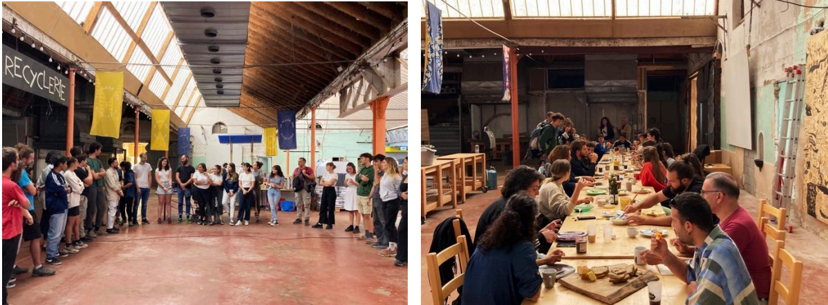
Fig 7-8. La Place des Possibles, Saint-Laurent-en-Royans, Francia. Il progetto ASOC ha l'interesse di creare connessione tra tre scuole di architettura, con progetti di comunità locali in aree marginali e una generazione di architetti-attivisti organizzati in collettivi provenienti da Francia, Italia e Grecia. I pasti collettivi sono un momento di costruzione del team delle tre scuole, i collettivi e le realtà locali. Il cibo enfatizza l'importanza del costruire comunità, segnando un momento di condivisione di esperienze, valori e culture.

Nello specifico, attraverso alcune interviste ai membri del Collectif Etc 11 , si è provato a mettere a fuoco alcune questioni al centro della presente riflessione. L'esperienza al centro di questa riflessione ha amplificato la consapevolezza del collettivo riguardo alla situazionalità delle proprie pratiche come progettisti.