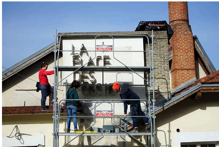
Fig 1. La Place des Possibles , Saint-Laurent-en-Royans, Francia. Dall’abbandono alla riconversione, attraverso un’esperienza progettuale e di ridefinizione di un’identità.

Fino a quel momento i loro progetti si concentrano infatti in aree urbane ‘contese’ – si vedano ad esempio il parlamento democratico mobile PaPoMo (proposto a più riprese a partire dal 2008), o la costruzione di spazi per la socialità e il gioco come Fraternité Belle de Mai (2018) e Parc de la Carraire (2017) – in cui l’occupazione dello spazio viene intesa come motore per rimettere in discussione i processi di trasformazione in corso, cercando di far emergere tematiche sociali ed ecologiche, coinvolgendo i cittadini nelle scelte politiche e nella successiva presa in carico degli spazi recuperati.