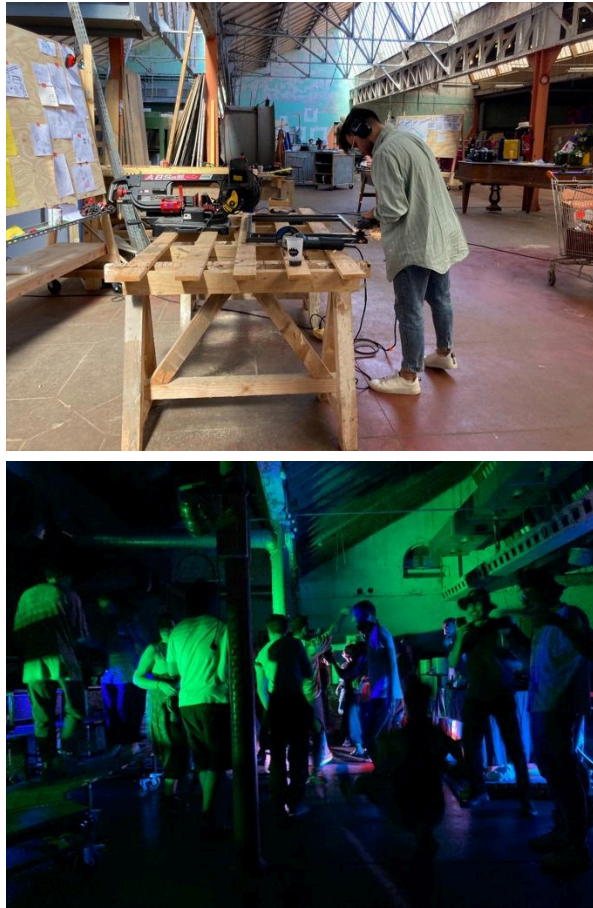
Fig 9-10. La Place des Possibles, Saint-Laurent-en-Royans, Francia. Attività di autoconstruzione praticate dagli studenti all'interno dei workshop ASOC. Eventi serali organizzati durante i workshop ASOC, con la partecipazione della comunità locale.

sociali che fanno convergere le persone in uno spazio per uno scopo comune. In questo modo, il concetto di commons è vicino a quello di comunità, in quanto l'uso comune che li contraddistingue può essere visto come una parte importante della costruzione simbolica della comunità stessa (Cohen, 1985; Fournier, 2013, Stravides, 2016). Tali spazi e i relativi processi di occupazione e riattivazione possono essere visti come un collante socio-ecologico che contribuisce quindi a costituire le comunità che li abitano (Federici, 2012).