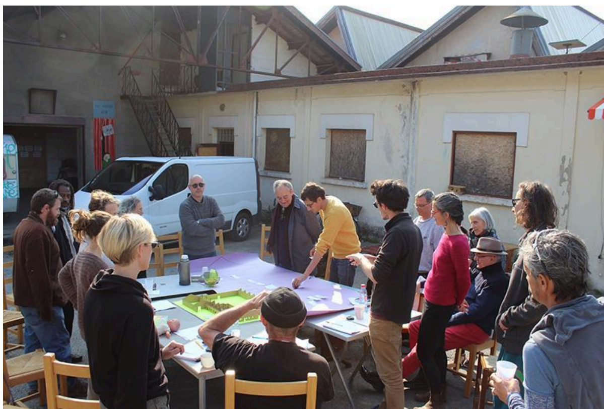
Fig 3. La Place des Possibles, Saint-Laurent-en-Royans, Francia. Co-progettazione per riconversione degli spazi tramite coinvolgimento attivo e ascolto della comunità locale.

Il progetto si presenta dunque come un processo di costruzione e definizione di un nuovo hub socio-culturale: l'elaborazione progressiva di una strategia partecipata: vengono organizzati dei momenti di confronto in cui la comunità locale è chiamata a dialogare, e vengono organizzati workshop di autoconstruzione con lo scopo sia di recuperare lo spazio, sia di allargare ulteriormente la rete di soggetti coinvolti. Un grande 'contenitore' di cui si co-progetta non solo la forma fisica dello spazio, ma anche nella forma dei contenuti, degli usi e dei soggetti che vanno progressivamente ad inserirvisi. Riemerge quindi il concetto di cura alla base dell'intera iniziativa, che è concepita per stimolare la presa in carico di questo spazio nel tempo attraverso una pluralità di sguardi, cercando di rinsaldare ulteriormente una comunità per certi versi fragile poiché localizzata al margine rispetto all'erogazione di numerosi servizi. La Place des Possibles si costituisce quindi non tanto come strumento di contrattazione politica in luoghi in cui il valore d'uso del suolo è elevato, ma al contrario come occasione per mettere a sistema una serie di know-how e di iniziative già in essere, producendo dal basso i servizi necessari per la comunità stessa, costruendo uno spazio di scambio reciproco e condiviso.