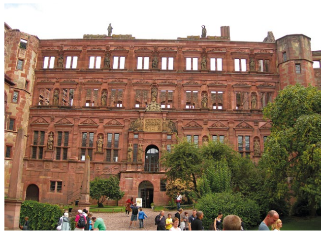
fig. 10 – Heidelberg: le rovine del castello che rappresenta uno dei simboli della città e mostra un interessante intervento di conservazione integrata con funzioni ricettive, museali e turistiche.