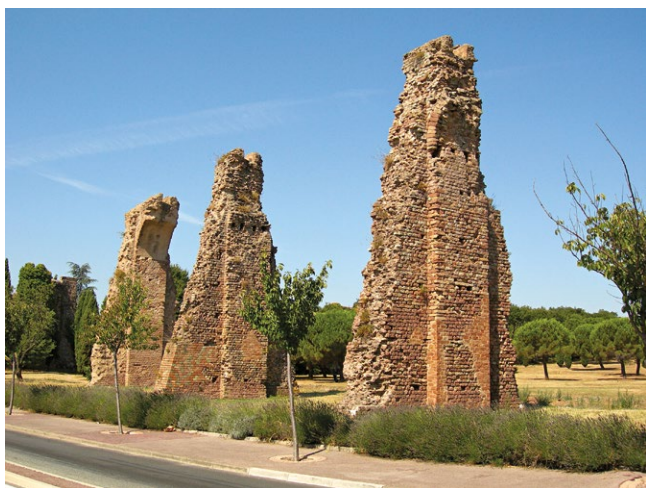
fig. 3 – Fréjus: le imponenti rovine dell’acquedotto romano oggi completamente decontestualizzate e inserite in un quartiere periferico di edilizia residenziale e centri commerciali.