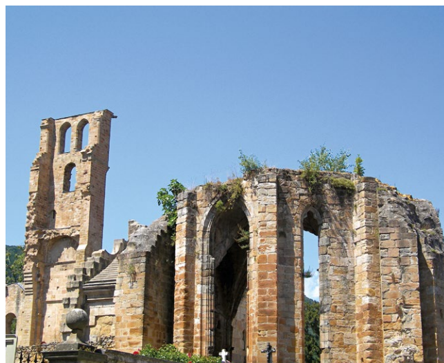
fig. 6 – Alet-les-Bains: le rovine dell'abbazia medievale di Notre-Dame, unici elementi superstiti del complesso architettonico in parte distrutto durante la Rivoluzione francese.