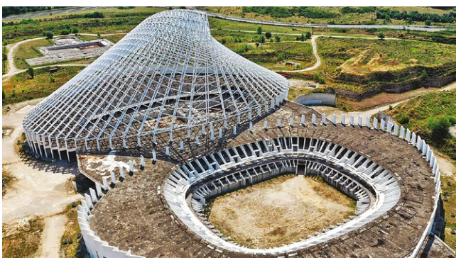
fig. 12 – Roma: la Città dello sport, commissionata dall'Università di Tor Vergata all'architetto Santiago Calatrava, e mai completata. Essa rappresenta un eccezionale caso di rovina che merita di essere tutelata, conservata e valorizzata anche solo come imponente rovina contemporanea.

diversi ambiti di studio rendendo accessibile l'insieme delle informazioni alle diverse scale.