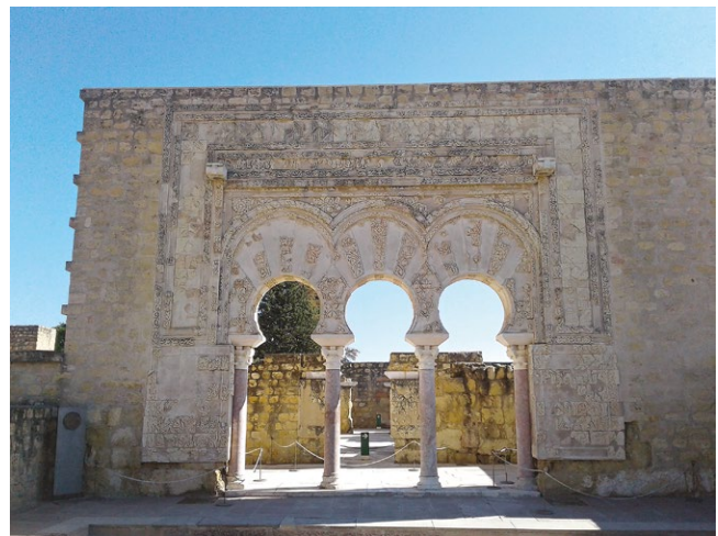
fig. 9 – Cordova: il complesso palaziale di Madinat al-Zahrā, eccezionale esempio di insediamento urbano risalente alla dominazione araba della Spagna meridionale.

Quindi tali contesti possono essere definiti "paesaggi di rovine" e rappresentano, più di ogni altra categoria, un "patrimonio a rischio" prima di tutto perché essi spesso non interessano le logiche di un immediato riscontro di immagine in termini di propaganda politica; in secondo luogo perché essi non si prestano a quelle valorizzazioni (quelle purtroppo più richieste) legate non tanto alla divulgazione della conoscenza e alla conservazione del bene, ma al suo sfruttamento intensivo a fini turistici o meramente utilitaristici attraverso destinazioni d'uso quasi sempre incompatibili: risulterebbe, infatti, difficile attribuire un uso diverso da quello strettamente culturale a un tratto di strada romana, a un acquedotto, a una necropoli, ai frammenti di una cinta muraria, a una torre di vedetta, a una piccola pieve di campagna.