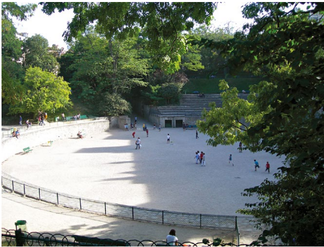
fig. 1 – Parigi: Les Arènes de Lutèce , antico anfiteatro gallo-romano oggi luogo di aggregazione sociale dell'intero Quartiere Latino.

marque de la grande ville. Elles sont un monument unique. Le conseil municipal qui les détruirait se détruirait en quelque sorte lui-même. Conservez les arènes de Lutèce. Conservez-les à tout prix. Vous ferez une action utile, et, ce qui vaut mieux, vous donnerez un grand exemple 9 .