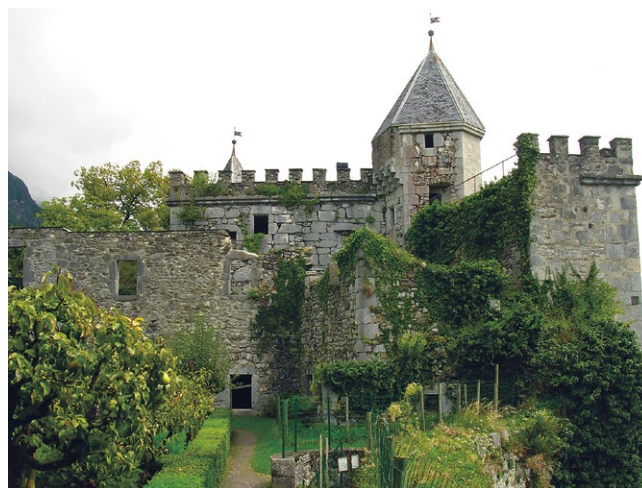
fig. 4 – St-Pierre-d’Albigny: il castello di Miolans raro esempio di conservazione integrata con funzioni abitative e museali di una porzione della rovina.

In tal modo l’Italia dimostrò di allinearsi alle politiche di tutela di altri paesi europei che ormai da tempo avevano fatto delle rovine nei contesti paesaggistici gli strumenti più efficaci per comunicare, soprattutto al pubblico meno colto, attraverso tracce visibili e tangibili, la storia del territorio: la rovina era considerata, al pari delle altre manifestazioni architettoniche utile strumento