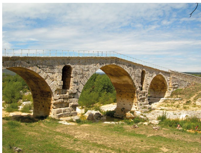
fig. 7 – Apt: il ponte romano ancora perfettamente conservato e utilizzato come collegamento viario tra il centro urbano e i territori limitrofi.