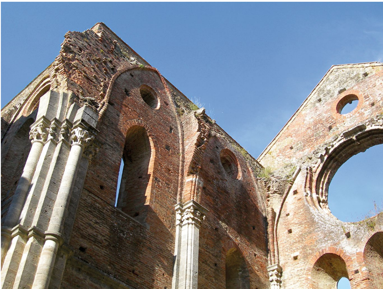
fig. 2 – Chiusdino (Siena): le rovine dell'abbazia di San Galgano, eccezionale intervento di conservazione allo stato di rudere realizzato da Gino Chierici negli anni Venti del secolo scorso.

Tuttavia a livello europeo vi erano, allora, posizioni contrastanti circa la conservazione di un patrimonio storico ritenuto, il più delle volte inutile. La dimostrazione, almeno in territorio italiano, è rappresentata dalla posizione, ben nota, dei Futuristi i quali disprezzavano i documenti del passato, rovine comprese, a tal punto da suggerirne la totale distruzione sia in ambito urbano sia in ambito paesaggistico. In tal senso si esprime Umberto Boccioni che auspica una sempre maggiore