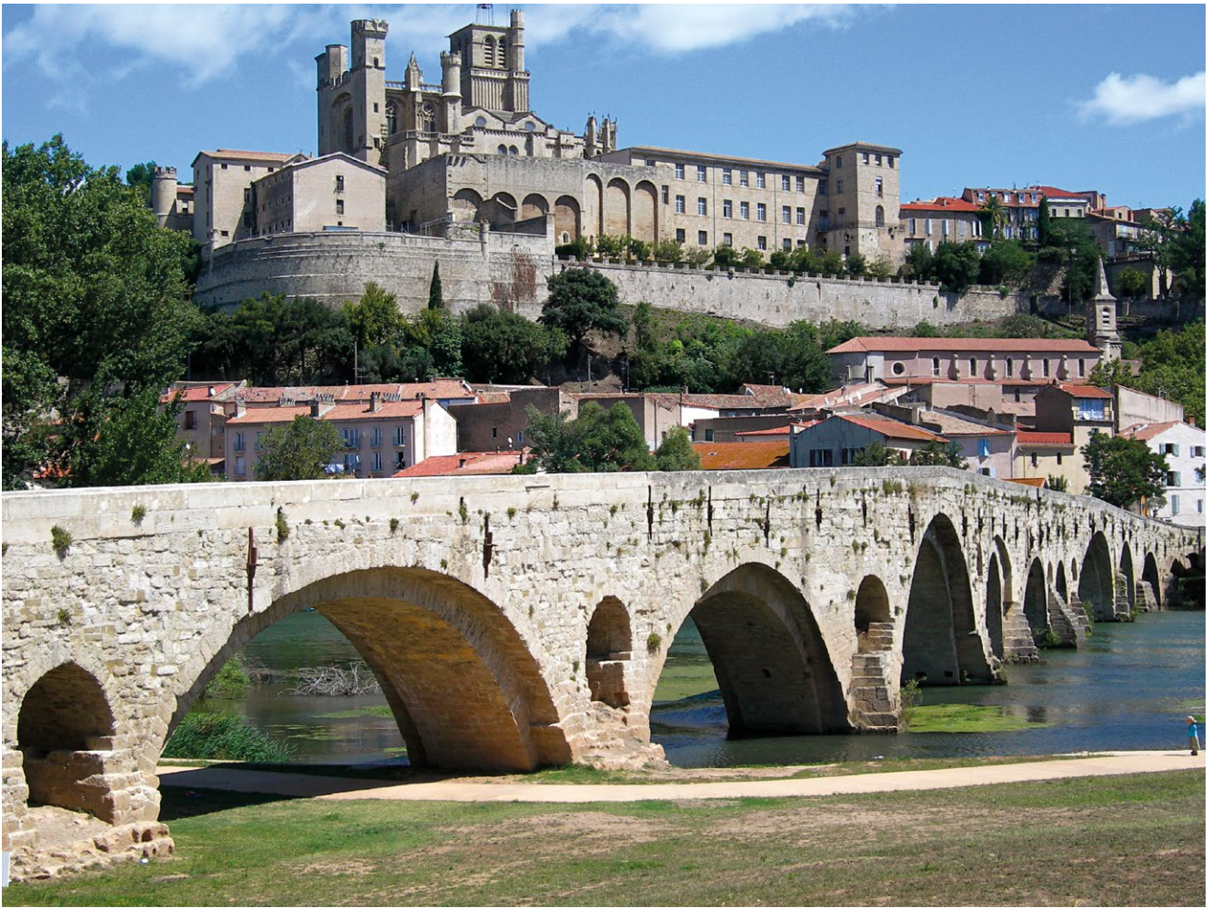
fig. 8 – Béziers: il Pont Vieux , uno dei pochi edifici romani superstiti assieme alle rovine dell'anfiteatro e ai pochi frammenti del teatro.

un atteggiamento spesso presente tra amministratori e economisti, a cosa può servire un antico acquedotto che ha perso la sua originaria funzione se non ad intralciare la realizzazione di infrastrutture stradali e ferroviarie? Quanto pesa economicamente l'insostenibile gestione e manutenzione di un rudere archeologico rispetto ai vantaggi di collegamenti sempre più veloci ed efficaci?