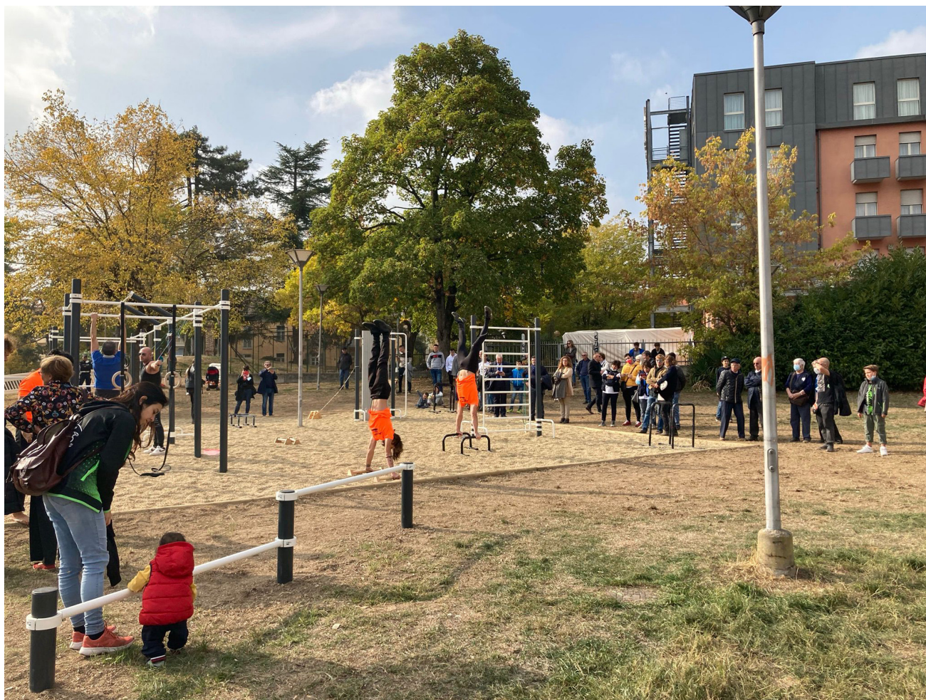
Fig. 2. The new park for sports activities realised in Mondovi thanks to the Parkout project.

persons with disabilities”. This goal has become even more crucial during pandemic-related restrictions (De Luca et al. , 2021).