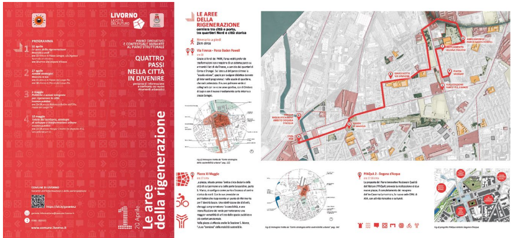
Fig. 02 | Locandina dell’iniziativa “quattro passi nella città in divenire” organizzata dal comune. Comune di Livorno.

Int.1: “Abbiamo fatto un avviso pubblico, [...] una call per la raccolta di contributi e proposte, per declinare appunto i contenuti del piano, leggendoli sulla base degli obiettivi che erano stati enunciati nell’avvio del procedimento. Guardavamo soprattutto alle azioni di trasformazione da inserire nel piano operativo... però, ci sono stati in quella sede anche contributi di carattere più trasversale, quindi, anche sulle risorse territoriali, sui temi della tutela e della conservazione...”