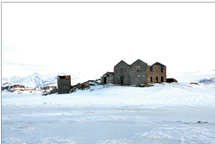
Figura 5 Fattoria abbandonata di Viðborðssel, Sveitarfélagið Hornafjörður.

Cosa rimane degli eventi narrati da Laxness attraverso gli occhi di Bjartur e Ásta Sóllilja? Se le case di torba abbandonate non lasciano tracce e scompaiono nel terreno, oggi buona parte delle case rurali progettate dall'Ufficio tecnico sono diventate rovine nel paesaggio agricolo islandese (Gísli Sverrir Árnason, Sigbjörn Kjartansson 2011-14) [fig. 5].