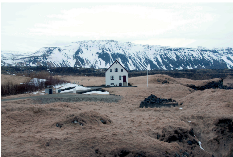
Figura 3 Casa rurale ad Arnarstapi, penisola di Snæfellsnes, anni Trenta-Quaranta. Foto di Sofia Nannini, 2019

Laxness osserva questo fenomeno con attenzione e ironia, quando illustra il progetto del facoltoso figlio dell'ufficiale distrettuale: