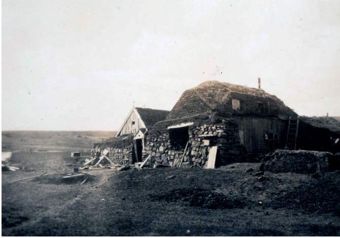
Figura 1 Il casale di Sænautasel, ca. 1925-30.

smo letterario in Islanda, dove solitamente si preferisce proporre la fruizione di una natura 'incontaminata' più della conoscenza di prodotti umani e letterari.