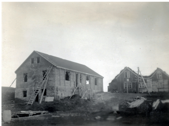
Figura 4 Fattoria in costruzione a Fornihvammur, 1927-30.