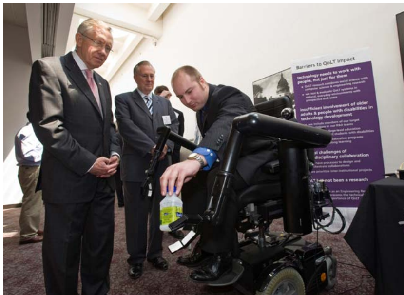
Fig. 2. « Demo » di un robot.

( http://www.nsf.gov/news/news_images.jsp?cntn_id=115211&org=OLPA , Credit : Sandy Schaeffer for National Science Foundation).