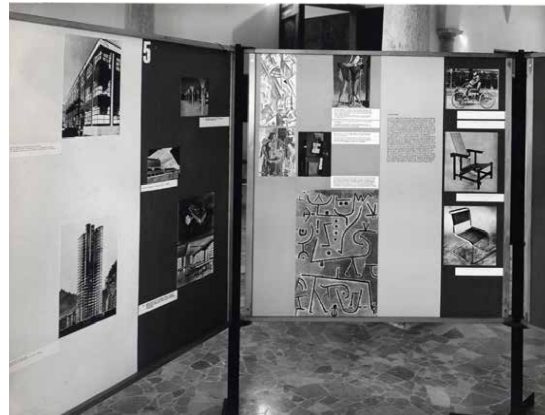
← 3-4. L'estetica nel prodotto , a cura di Carlo Pagani, La Rinascente, Milano, 19-31 ottobre 1953, veduta dell'allestimento nel reparto mobili.