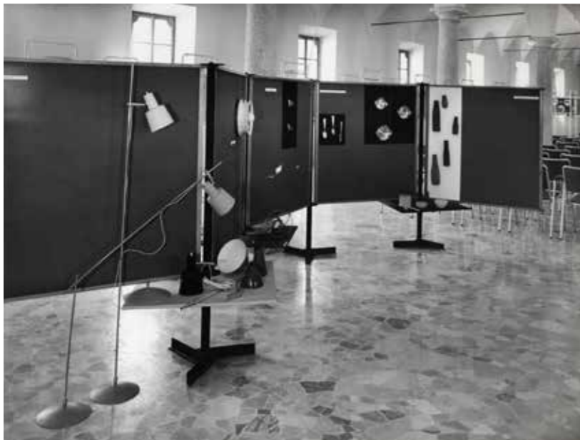
↑ 6. Arte tecnica e cultura e Disegno industriale , a cura di Alberto Rosselli et al., Museo della scienza e della tecnica, Milano, 6-12 luglio 1953, pannelli con presentazione di prodotti industriali.