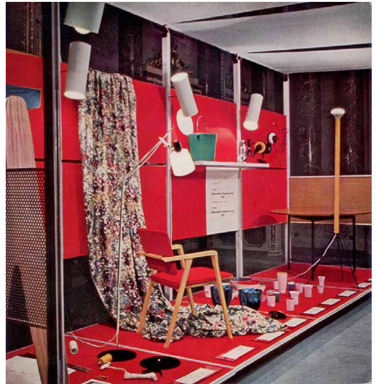
9. Mostra del Compasso d'oro , Circolo della stampa, palazzo Serbelloni, Milano, 1955, vista dell'allestimento.