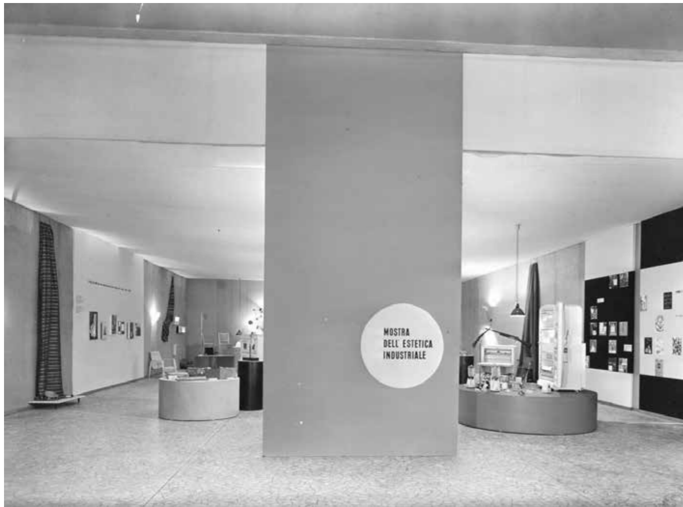
1. Il Mostra dell'estetica industriale , a cura di Mario Ballocco, XXXI Fiera campionaria, Milano, 12 aprile-29 aprile 1953, ingresso dell'esposizione.