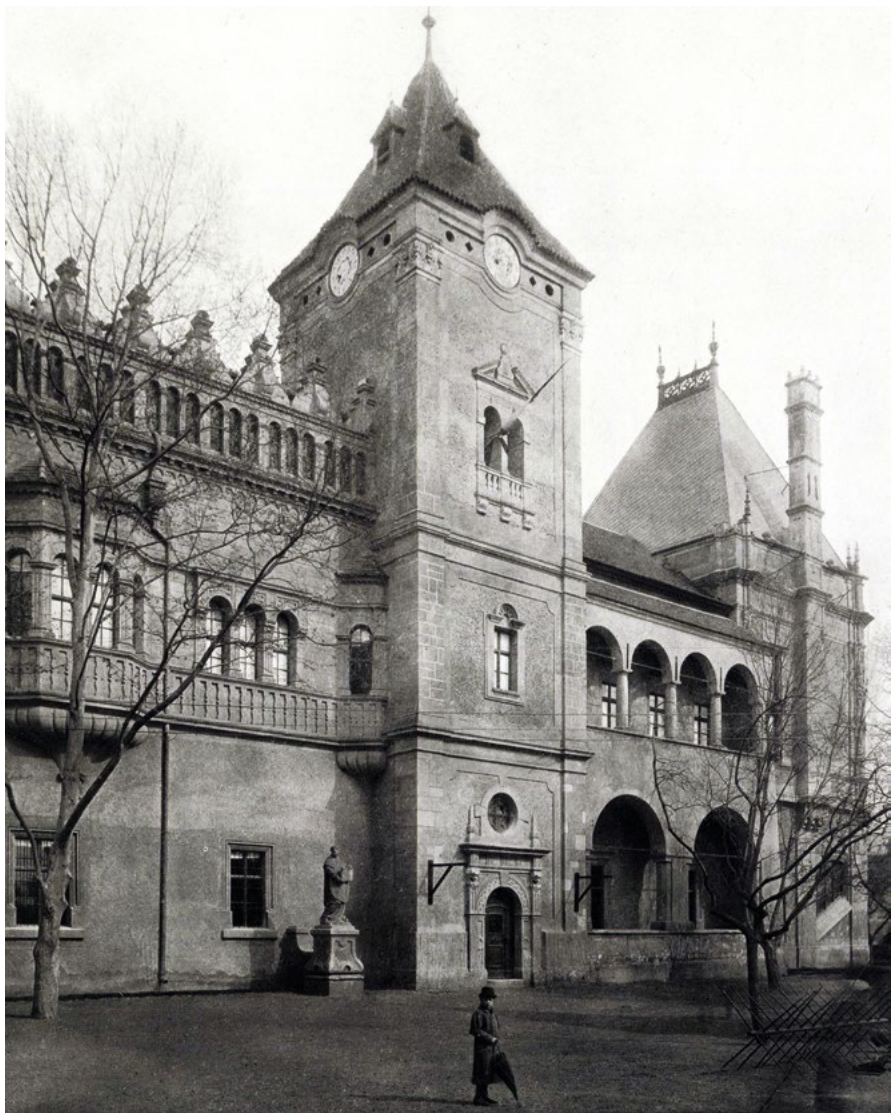
Fig. 5 - Il "Gruppo Storico" all'Esposizione del Millenario del 1896 a Budapest, veduta della sezione gotica (castello del Vajdahunyad) ricostruzione permanente del 1902-07 su progetto Ignác Alpár (foto 1935, Fortepan, ID 20321).

Fig. 4 - Facciata laterale della sezione rinascimentale-barocca: riproduzione della casa Rákóczy di Eperjes, della torre del municipio di Lócse e di un padiglione "francese" nei modi del tempo di Francesco I, realizzate su progetto di Ignác Alpár (foto di György Klösz, 1900, Budapest Főváros Levéltára, Fortepan, ID 82013).