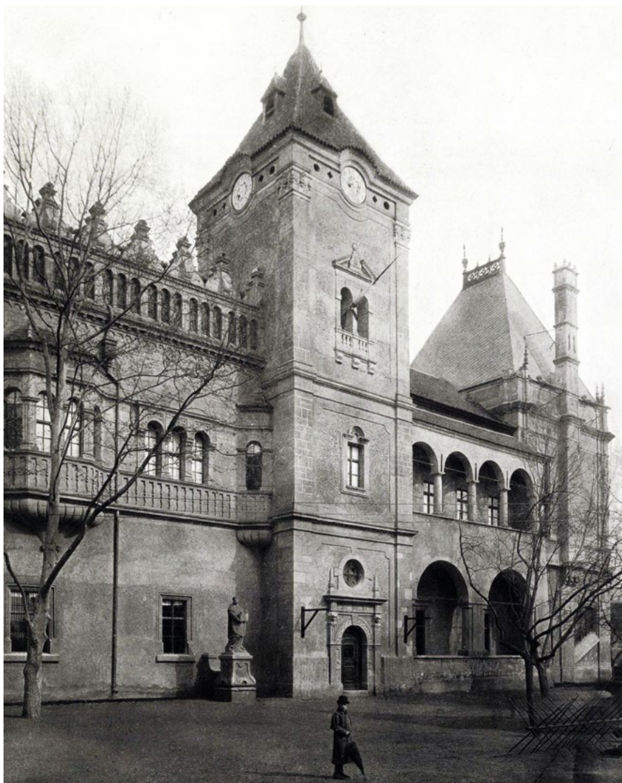
Fig. 5 - Il "Gruppo Storico" all'Esposizione del Millennario del 1896 a Budapest, veduta della sezione gotica (castello del Vajdahunyad) ricostruzione permanente del 1902-07 su progetto Ignác Alpár (foto 1935, Fortepan, ID 20321).

Fig. 4 - Facciata laterale della sezione rinascimentale-barocca: riproduzione della casa Rákóczy di Eperjes, della torre del municipio di Lócse e di un padiglione "francese" nei modi del tempo di Francesco I, realizzate su progetto di Ignác Alpár (foto di György Klösz, 1900, Budapest Főváros Levéltára, Fortepan, ID 82013).