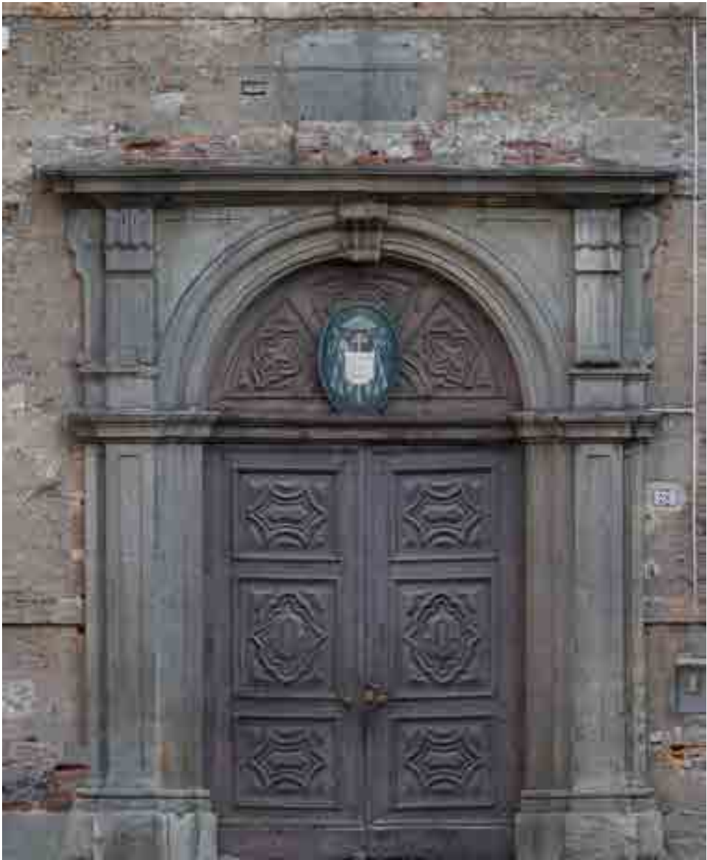
5: Vista frontale del portale ottenuta dal modello digitale ricostruito mediante l'impiego di tecniche fotogrammetriche: la rappresentazione mette in evidenza i caratteri architettonici e materici con qualità fotorealistica (elaborazione dell'autore, 2022).

portale, rappresenta infatti una sorta di spazio ibrido tra due forme di vita governate da regole ben distinte. Un sistema, dunque, di contatto tra la realtà iper-normata del Seminario e la società civile eporediese, un contatto a sua volta governato da ulteriori