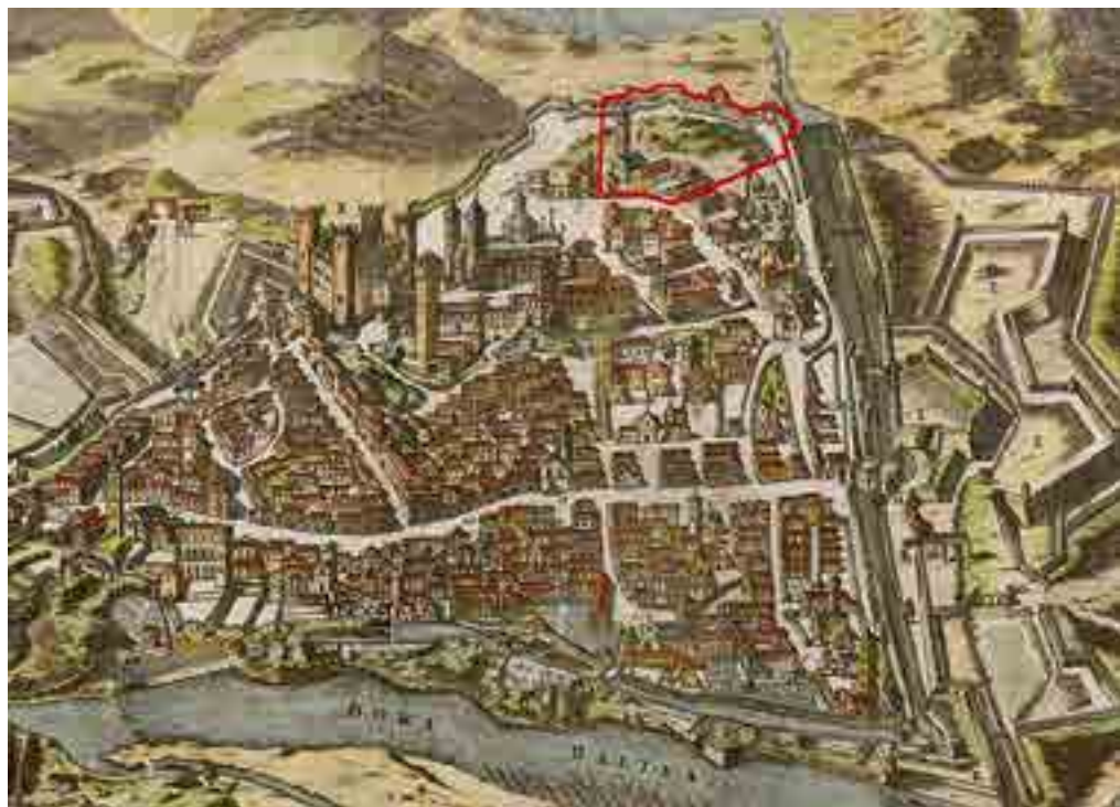
1: Veduta della città di Ivrea: in evidenza la zona che sarà destinata alla costruzione del nuovo Seminario nell'area compresa tra l'antica chiesa di San Pietro, alcuni edifici civili e una porzione delle antiche mura ( Theatrum Sabaudiae , Amsterdam 1682, 2 voll., I).

civili verso la parte bassa della città, con l'effetto di conferire una connotazione sempre più religiosa alla parte in quota, in stretta relazione con la cattedrale, con l'arcivescovo, con il palazzo per il Seminario Maggiore e successivamente con il nascente Seminario minore. Tale connotazione sembra ancora oggi consolidata, così come dimostra la distribuzione di realtà religiose in quest'area di Ivrea. Con il Seminario minore, inoltre, il suo analogo Maggiore condivide, ancor oggi, non solo l'affaccio sulla stessa via, ma anche una serie di spazi, così come i due complessi per la formazione del clero sono collegati da un sottopassaggio che permette di evitare l'attraversamento della strada pubblica.