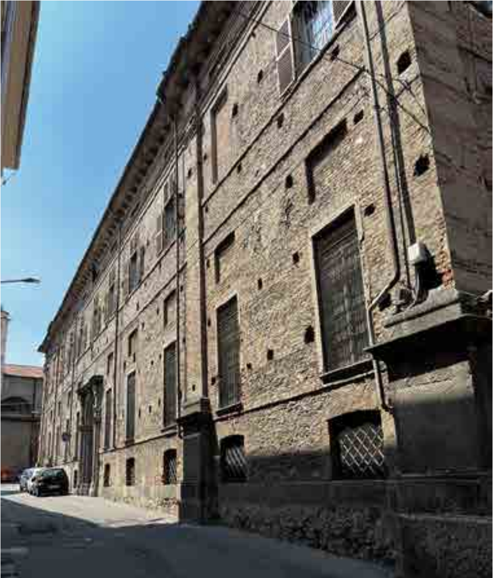
3: Vista del Seminario dall'affaccio lungo via Sant'Arborio. Posto centralmente il portale in pietra di serizzo.

La lacuna documentaria rende necessaria l'integrazione degli studi con ulteriori strumenti di supporto, a cominciare da una celere campagna di rilievo, allo scopo di avere una più chiara lettura della conformazione dell'edificio e della ripartizione interna dei principali ambienti del piano terreno, mediante l'utilizzo di strumenti LiDAR e fotogrammetrici di tipo terrestre. Il rilievo speditivo è stato eseguito lungo il perimetro esterno e internamente al cortile dell'edificio, all'interno del giardino e nei principali