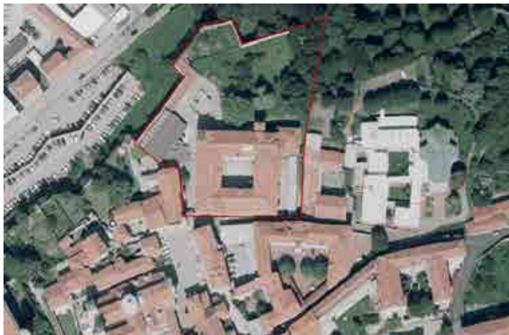
2: Ortofoto dell'area di studio in cui si evidenzia il rapporto con gli altri spazi ed edifici della città (Geoportale Piemonte, ultima consultazione: maggio 2022).

si ultimano le prime due maniche, tra loro contigue e ortogonali, mentre le ulteriori porzioni a completamento del palazzo risalgono alla campagna degli anni 1746-1750. In questa seconda fase, a conclusione dell'impianto planimetrico e a formazione del cortile porticato, ha origine la differenziazione delle due ulteriori maniche, compiuta tuttavia senza alterare i fronti del palazzo, ricavando lo spazio per un ulteriore piano.