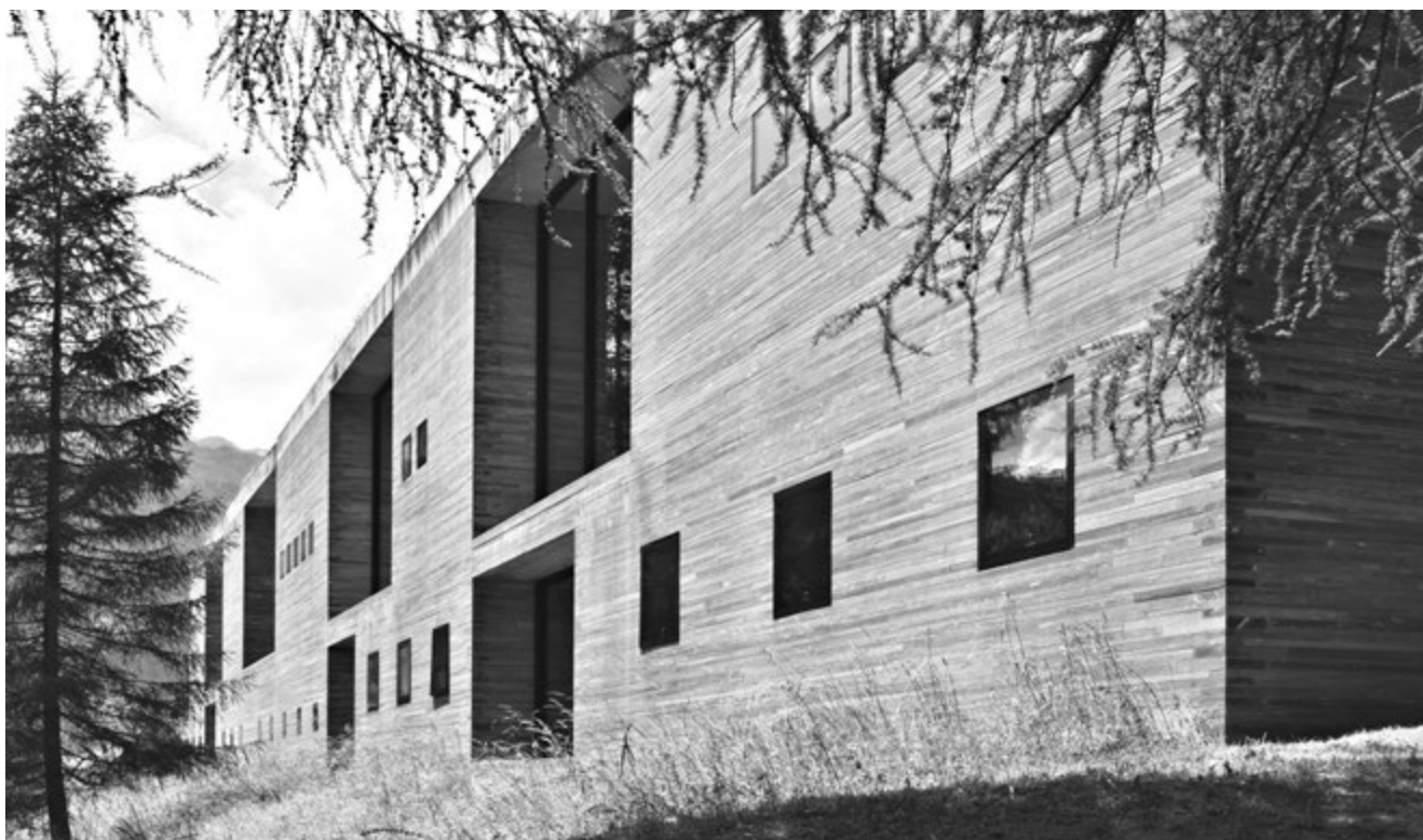
[FIG. 1] Peter Zumthor, Terme di Vals (1996). Foto dell'autore

La prima è una piccola architettura sacra che domina dall'alto la frazione rurale di Sogn Benedetg nella Surselva grigionese con il suo volume pseudo-cilindrico (che in pianta è in realtà una mezza lemniscata) dall'aspetto monolitico dato dal rivestimento continuo in scandole di larice. La seconda, opera che ha eletto Zumthor a star del panorama architettonico internazionale, è ancora una volta un volume monolitico, stavolta realizzato con il cosiddetto "muro composito di Vals", per metà incastonato nel terreno come una formazione geologica, completamente alieno rispetto al contesto di alberghi e residence costruiti negli anni Sessanta in cui è calato. Entrambi gli edifici sono rappresentativi di quella ricerca dell'architettura svizzera che a partire dalla metà degli anni Ottanta concepisce gli edifici come corpi geometrici semplici e chiari, dove «la semplicità conferisce una grande importanza alla forma, ai materiali, al colore [...] progetti che si caratterizzano per la ricerca di forme forti» (Steinmann 1991, 7).