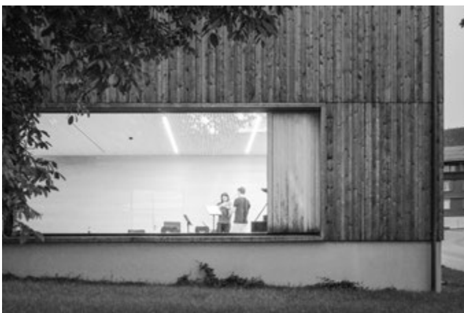
[FIG. 5] Bernardo Bader con Hermann Kaufmann & Bechter Zaffignani, Pfarrhaus Krumbach (2013).