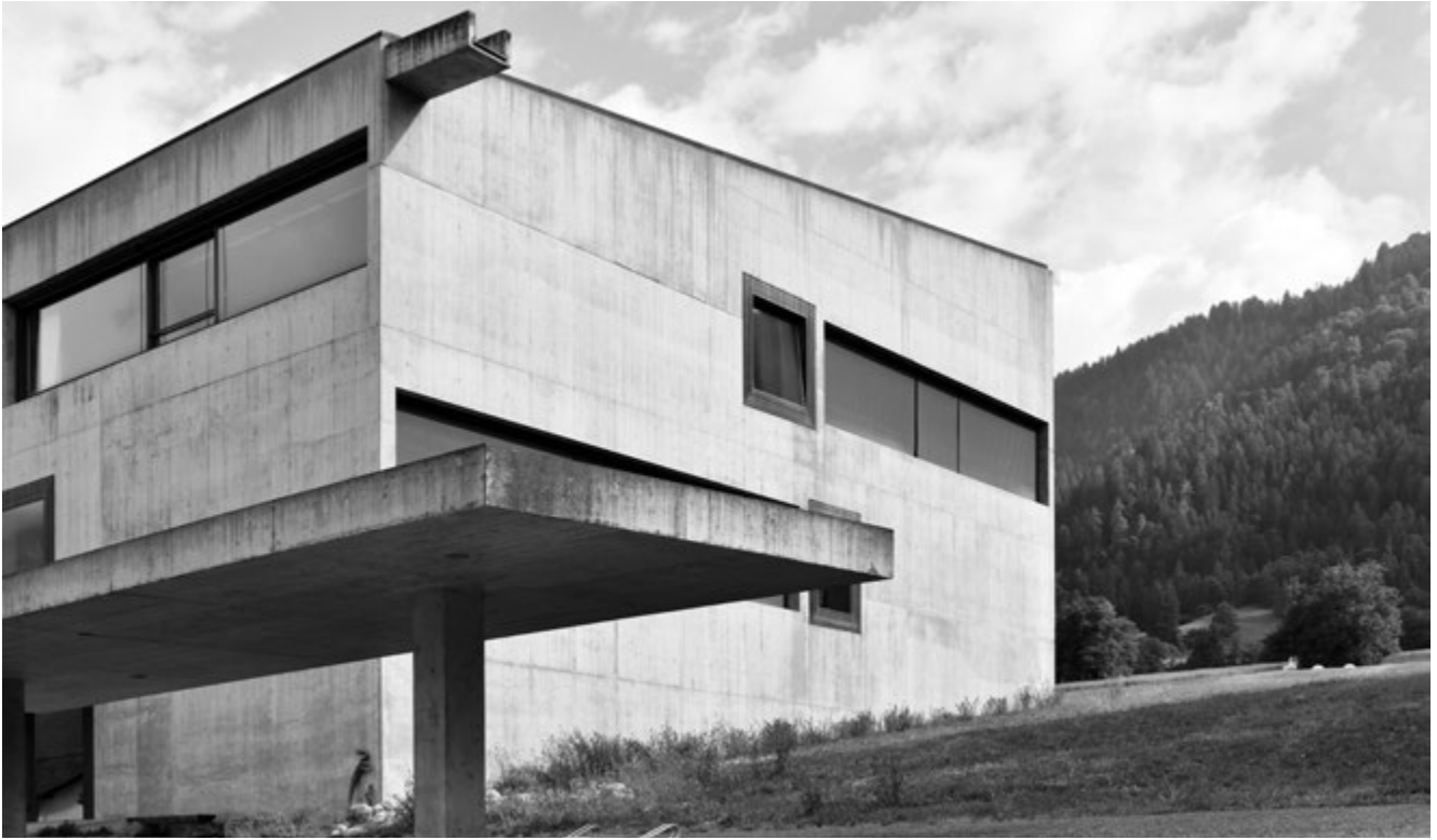
[FIG. 2] Valerio Olgiati, Scuola a Paspels (1998). Foto dell'autore