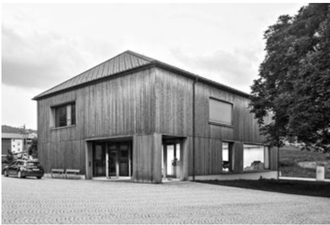
[FIG. 4] Bernardo Bader con Hermann Kaufmann & Bechter Zaffignani, Pfarrhaus Krumbach (2013).