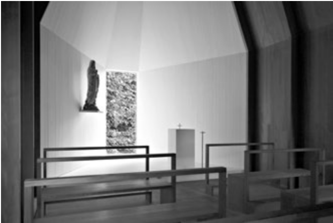
[FIGG. 6, 7] Bernardo Bader, Cappella Salgenreute (2016).