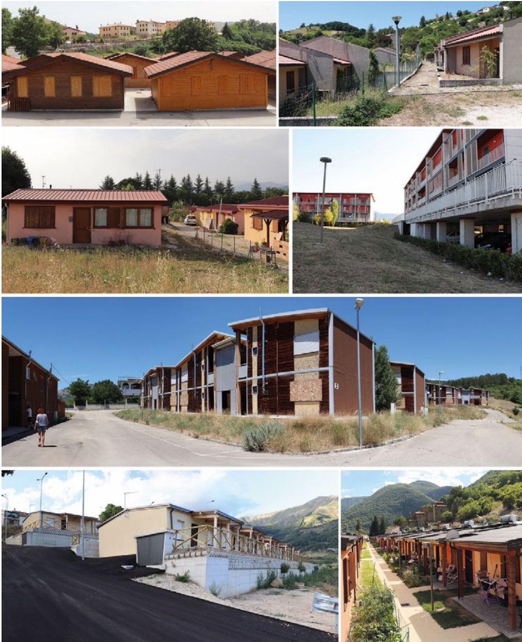
3: Composizione fotografica esemplificativa delle soluzioni temporanee di seconda emergenza ancora permanenti nei territori. Dall'alto i villaggi prefabbricati post 1997 ad Annifo, Foligno; in seguito, i MAP mono piano di San Demetrio ne' Vestini, il progetto C.A.S.E. Coppito 3 - L'Aquila e i MAP a due piani, abbandonati, a San Vittorino - Cansatessa (AQ) e in basso a sinistra il progetto S.A.E. a Campotosto non ancora consegnato ad agosto 2021, e a destra area S.A.E. di Villa Sant'Antonio a Visso (MC). Le foto sono state scattate dagli autori nell'estate 2021.