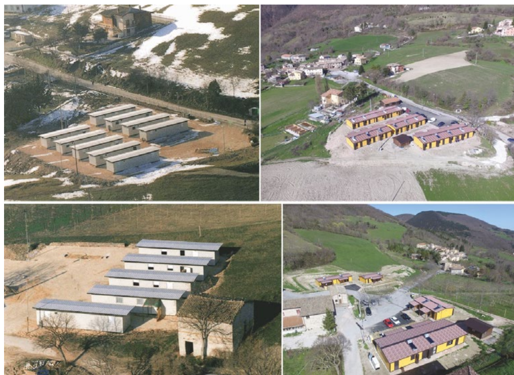
4: Le medesime aree a Costafiore (in alto) e Massapofoglio (in basso), frazioni di Muccia (MC), allestite per l'emergenza abitativa nel post-sisma del 1997 come campi container (a sinistra) e riutilizzate come aree per le Soluzioni Abitative d'Emergenza post eventi 2016/2017 (a destra). Le immagini a sinistra sono tratte dalla pubblicazione del Presidenza del Consiglio dei Ministri - Dipartimento della Protezione Civile. (1998). Insediamenti di emergenza in Umbria e Marche: crisi sismica 1997-1998, mentre le immagini a destra sono tratte dalla mappa interattiva nel sito della Regione Marche. https://www.regione.marche.it/Regione-Utile/Terremoto-Marche/SAE-soluzioni-abitative-in-emergenza .