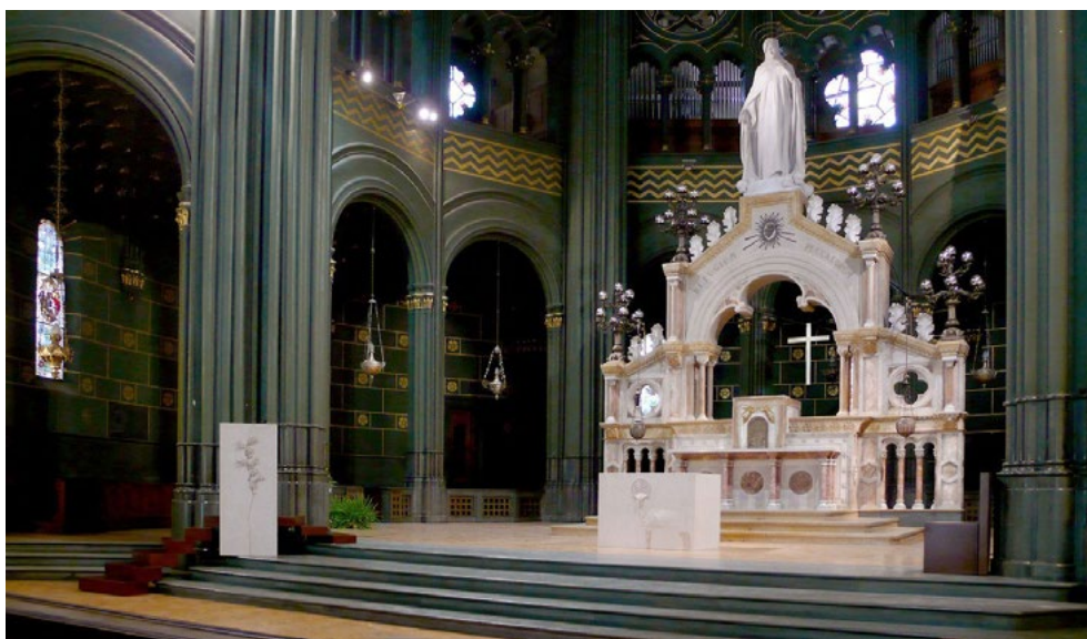
Figura 2. Torino, Chiesa Sacro Cuore di Maria, dettaglio dell'area presbiteriale dopo gli interventi di adeguamento liturgico.

post belliche, tra la fine degli anni Sessanta e la prima metà degli anni Settanta, i successivi fenomeni socio-demografici dovuti al forte impulso nella crescita industriale del paese, vedono una significativa richiesta di costruzione di nuove chiese e adeguamento di quelle esistenti alle norme conciliari 2 .