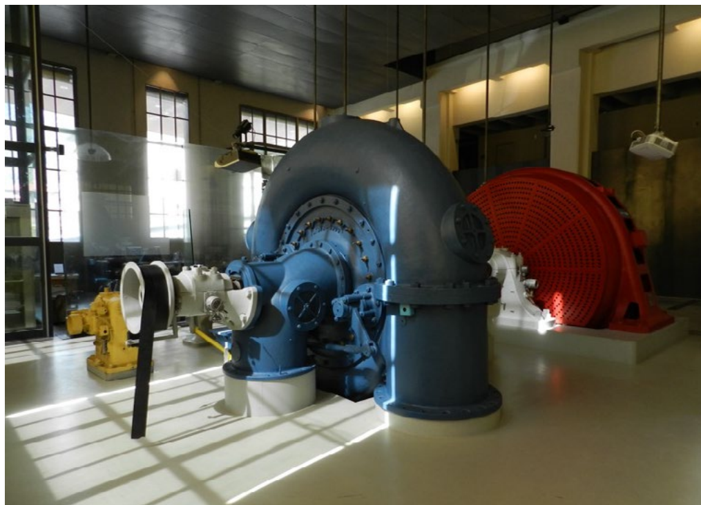
2: Museo dell'Energia idroelettrica, Cedegolo (Brescia).

fondamentale che la ricerca scientifica e l'impegno umano hanno avuto nel contribuire alla modernizzazione dell'Italia (Fig. 2).