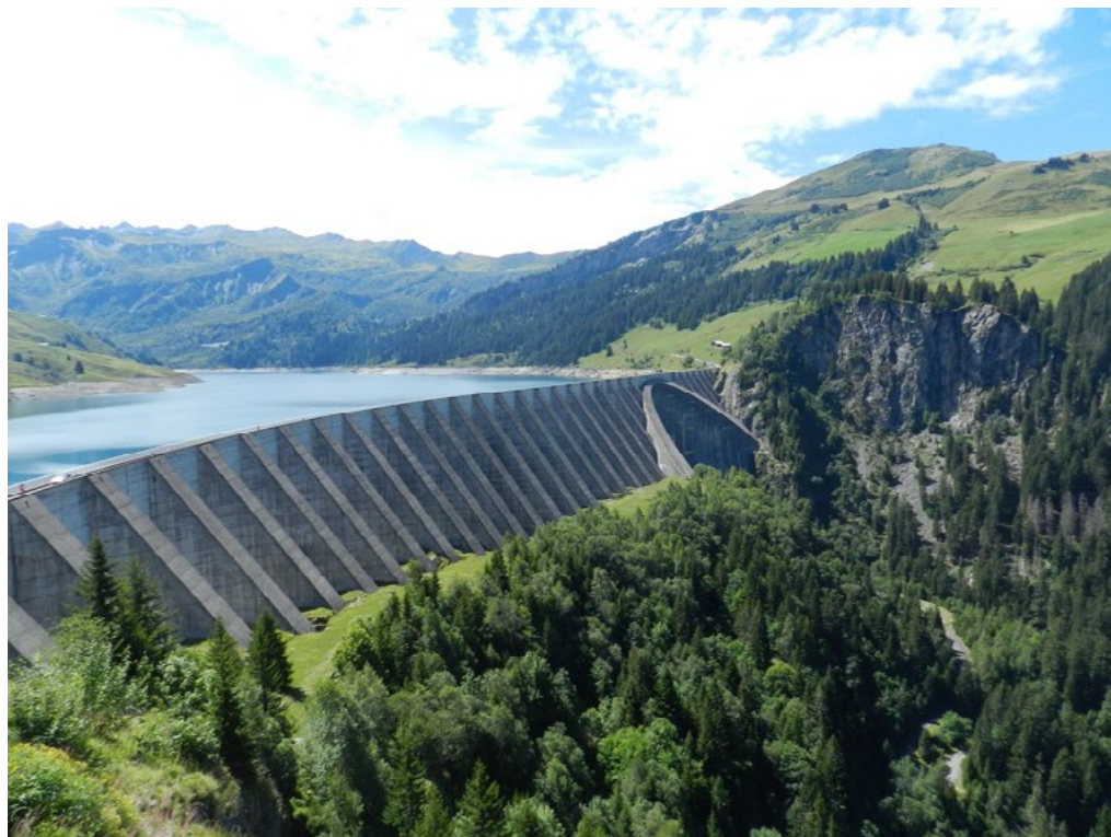
I: Paesaggi idroelettrici rinaturalizzati: la diga di Roselend (Savoia, Francia).

Il patrimonio dell'idroelettricità che costella le vallate montane testimonia la storia di questi territori, l'attività di trasformazione svolta dall'uomo e il suo impatto sull'ambiente e sulla società [Fontana 2008]. È un patrimonio industriale in buona parte ancora attivo e mantenuto, che ha conservato nel tempo la stessa funzione per la quale era stato originariamente realizzato. Tale patrimonio costituisce un'importante risorsa culturale, capace di intercettare l'interesse sia di persone desiderose di conoscere le specificità dei luoghi, la loro storia e le loro molteplici trasformazioni, sia di coloro che, coinvolti nel dibattito avente per oggetto le risorse energetiche, intendono approfondire le tematiche connesse alle modalità di produzione e impiego di energie rinnovabili [Mattone, Vigliocco 2020].