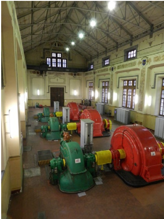
3: Centrale di Champagne 1, Villeneuve (Aosta, Italia). La centrale è aperta al pubblico per visite guidate organizzate dalla Compagnia Valdostana delle Acque.