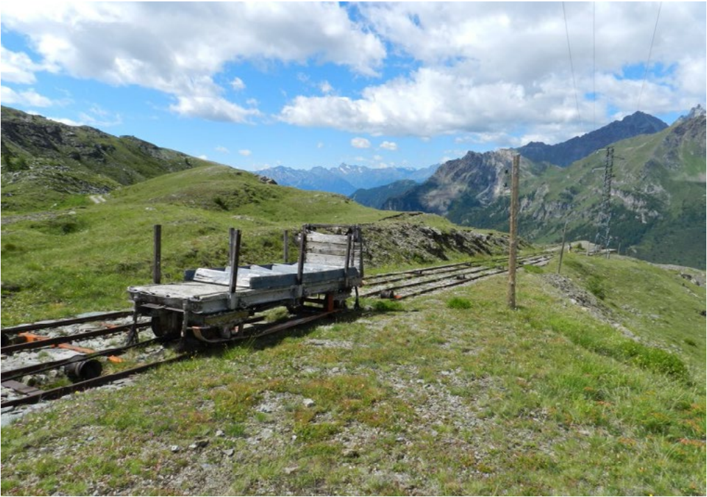
5: Valtournenche (Valle d'Aosta, Italia). Stazione di partenza della strada ferrata, realizzata in occasione della costruzione della diga del Goillet (Valtournenche, Valle d'Aosta) e inserita nel percorso Giri d'Energia – Diga del Goillet, (foto Manuela Mattone 2017).

presso il sito di Tyssendal, sono stati realizzati circuiti escursionistici che propongono ai visitatori di fruire del patrimonio industriale e delle risorse paesaggistiche locali compiendo a ritroso il tragitto effettuato dall'acqua - dalla diga sino alla centrale - percorrendo sentieri e arrampicandosi lungo le condotte forzate.