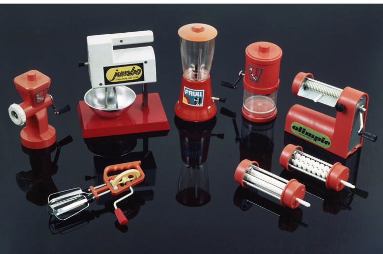
05 Alcuni piccoli elettrodomestici funzionanti con motori a pila degli anni Settanta.

Negli anni a venire la componente tecnologica entra gradualmente nella progettazione dei giocattoli accompagnandosi all'introduzione in massa degli elettrodomestici nelle abitazioni che ispirano prontamente l'immaginario de La Nuova Faro. Il riferimento non è più solo quello della massaia-cuoca o del falegname della tradizione. Le varie tipologie vengono "elettrificate" per rifornire il mercato con delle autentiche novità e così, ad esempio, nel 1969 nel settore dei giochi maschili ai trafori si affianca il primo trapanino elettrico Jolly Drill , con seghetto e smerigliatore («trafora, fora, lucida, smeriglia» riporta la pubblicità) come i primi trapani multifunzionali americani [7]. Per estensione è sviluppato anche un vasto assortimento di piccoli elettrodomestici, alcuni funzionanti con motori a pila [fig. 05]. Lo stereotipo della bambina che gioca con le pentole è superato, ora fa il bucato come la casalinga-mamma della società dei consumi usando Lily Bel , riproduzione dell'allora moderna lavastoviglie elettrica, con coperchio a campana trasparente per vedere i cicli operativi della macchina [8]. E ancora, tra i giocattoli per bambina che simulano la cura della casa e della famiglia, conoscono un autentico boom i ferri da stiro, come il modello Ariete o Stirella micromax . Sono tutti realizzati