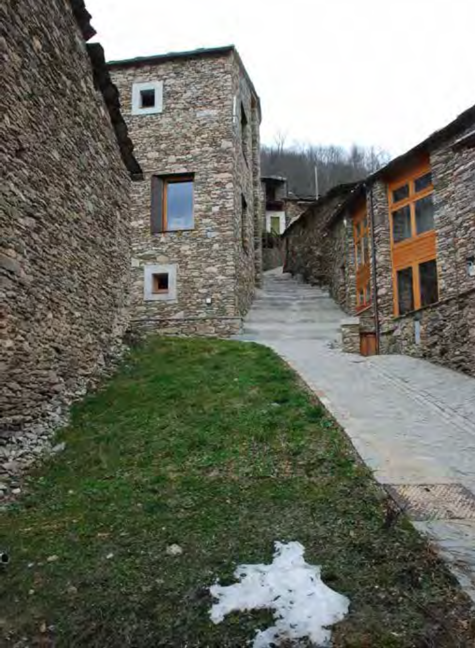
Fotografie che evidenziano la relazione con il paesaggio