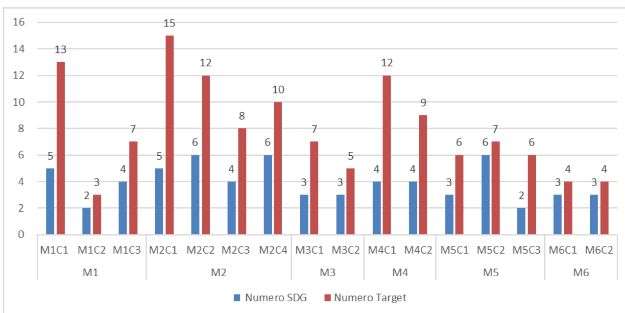
Figura 3: Contributo del PNRR agli obiettivi e target dell'Agenda urbana [Croci et al, 2022b]

I fondi del PNRR possono quindi contribuire al raggiungimento degli obiettivi e dei target individuati e all'implementazione delle misure e progetti inclusi nell'Agenda urbana. In particolare, la Figura 3 mostra a quali obiettivi e target dell'Agenda urbana può contribuire il PNRR.