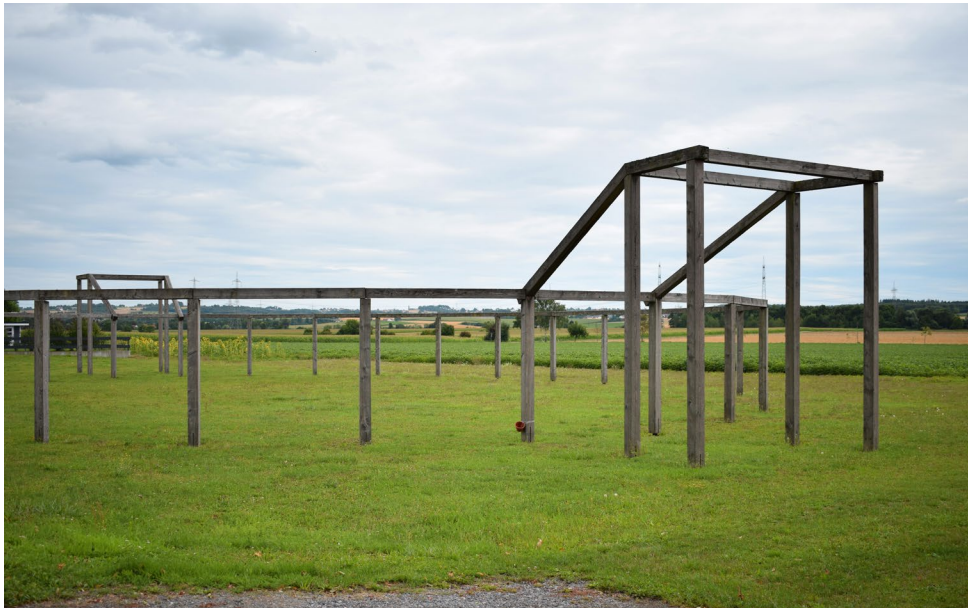
Figura 1. Künzing, Anfiteatro romano, ricostruzione dell'ingombro volumetrico.