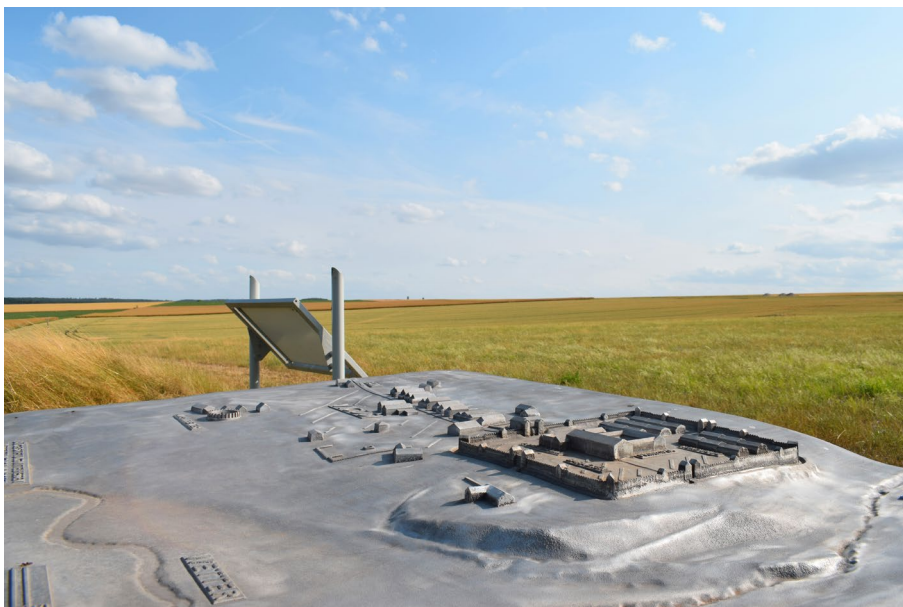
Figura 4. Arnsburg (Lich) , Anfiteatro romano, dettaglio delle installazioni lungo il percorso culturale-naturalistico.

specifica richiesta turistica. Inoltre, ad avvalorare la validità e l'attualità dei principi della Carta di Venezia, possono essere citati i recenti progetti relativi all'anfiteatro di Vetera e al teatro di Magontiacum 16 , in cui la volontà di un riuso consapevole nella società contemporanea e l'interesse a considerare anche il contesto paesaggistico dei monumenti, dimostrano un processo incline ad una maggiore salvaguardia del patrimonio, rispetto a quanto accaduto precedentemente. L'approccio conservativo delinea, quindi, nel suo complesso, l'adattamento a una matrice culturale europea, impegnata a sostenere una progettualità attenta e strutturata. Un percorso che andrà certamente monitorato e riesaminato alla luce dei prossimi sviluppi.