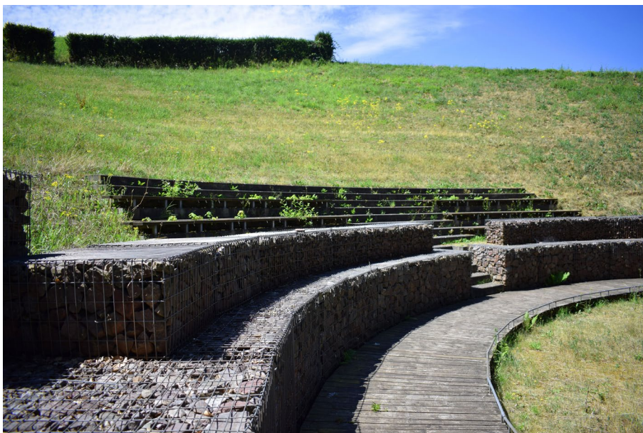
Figura 2. Kastel-Staadt , Teatro gallo-romano, intervento di conservazione e valorizzazione del sito.