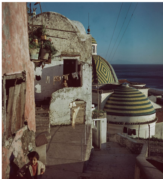
Figura 4. Maiori, Costiera amalfitana. Esempio di un ambiente urbano e paesistico (Archivio fotografico Roberto Pane, CAM.SA.P. 4bis_0002).

stesso Piero Gazzola, che in più occasioni sostiene la difesa di quell' ambiente umano , da non intendere «esclusivamente [come] l'habitat materiale in cui l'uomo vive, ma tutto quel complesso di strutture fisiche e morali che condizionano la vita umana» 18 .