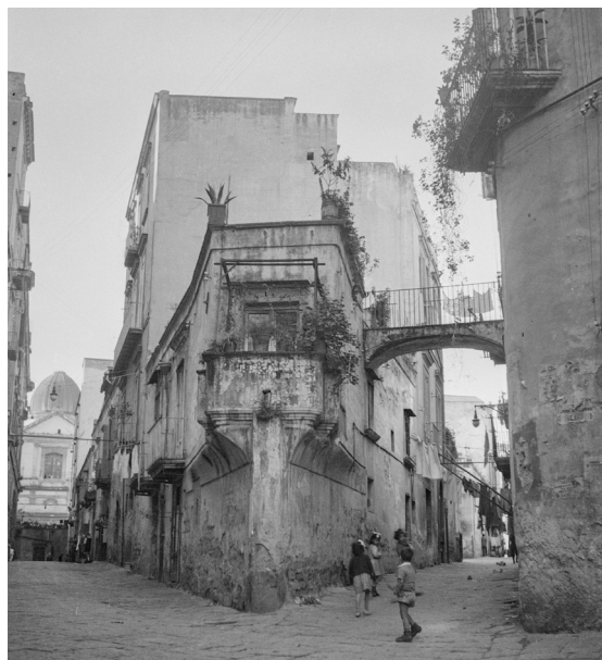
Figura 1. Napoli, vico Cimitile. Esempio di un ambiente urbano (Archivio fotografico Roberto Pane, NAP.N.112_0006).

esperto di restauro 3 , nel secondo, invece, si verifica una diretta collaborazione di entrambi, in profonda sinergia, nella redazione di un nuovo documento internazionale del restauro, in sostituzione alla precedente Carta di Atene del 1931 4 .