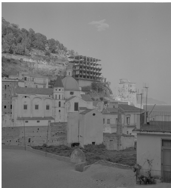
Figura 3. Cetara, Costiera amalfitana. Esempio di un nuovo edificio in costruzione a danno del paesaggio e dell'ambiente.