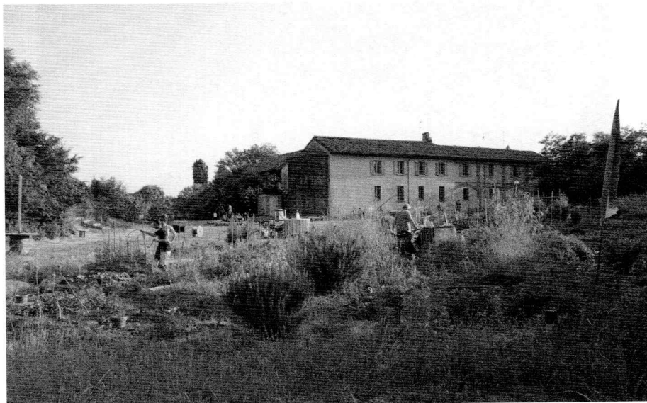
Figura 4. Milano, cascina Sant' Ambrogio, conservazione dell'originaria vocazione agricola e apertura a usi contemporanei (coworking, agriristoro, eventi socioculturali).