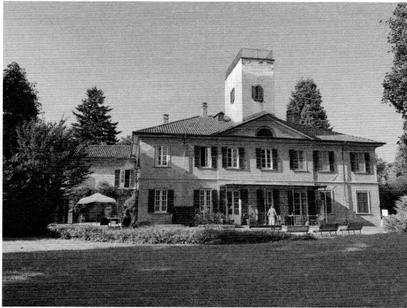
Figura 3. Seveso (MB), villa Dho, trasformazione da casa padronale a struttura aperta alla comunità.

sociale. Ciò si manifesta fin dalla fase della conoscenza, con una forte enfasi posta in molte progettualità sulle memorie collettive veicolate dall'architettura come mezzo per rinsaldare il rapporto tra il bene e la comunità.