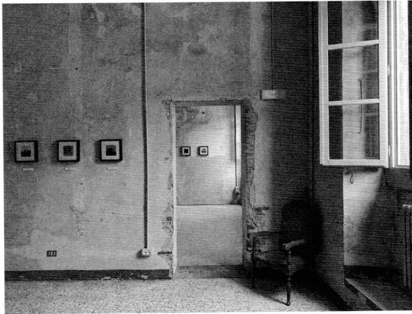
Figura 2. Sansepolcro (AR), palazzo Muglioni, realizzazione del centro per l'arte contemporanea CasermArcheologica.