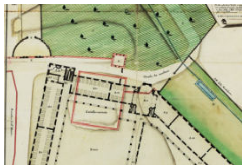
Fig. 2- Pianta eseguita dall'arch. Robilant. Si noti in rosso il profilo del castello e delle mura esistenti. (AST, Sezioni Riunite, Carte topografiche, Fondo camerale Piemonte, art. 663, n.2)

Dopo un secolo di incuria e abbandono il castello veniva descritto come una struttura fortemente degradata, utilizzata solamente come carcere in aggiunta ad altre strutture della città. Una nuova fase di prosperità economica e sociale, a partire dal Settecento, registrava ingenti interventi edilizi sul territorio comunale. Nella seduta del consiglio comunale del 6 gennaio 1769 venne deliberata la richiesta di autorizzazione per la concessione del terreno su cui insisteva il castello per la realizzazione di un nuovo ospedale civile e il 28 aprile 1769 Carlo Emanuele III di Savoia firmò l'atto di concessione. A partire dall'estate l'architetto Filippo Nicolis di Robilant si recò in città per rilevare il sito e avviare il progetto per la costruzione del nuovo edificio (Fig. 2). I disegni vennero consegnati l'anno successivo e il cantiere per la costruzione dell'ospedale venne avviato nel luglio 1770 (Mellino, 1988).