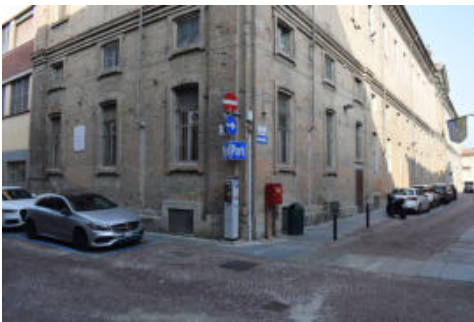
Fig. 6- In primo piano, il corpo monumentale settecentesco; sulla sinistra, l'innesto della manica realizzata a partire dal 1963

e scavi archeologici, con l'intento di ricucire una parte significativa del tessuto urbano della città (Fig. 6). Ciò al fine di restituire ai cittadini e all'intera comunità un frammento di storia