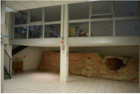
Fig. 4- Tratto del muro di fondazione del castello conservato nei locali interrati