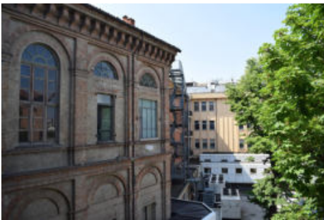
Fig. 5- Sulla sinistra una porzione dell'ala monumentale oggetto di futuri interventi di restauro. Sullo sfondo parte dell'ampliamento del 1976, oggetto della futura demolizione