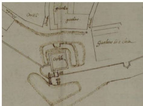
Fig. 1- Planimetria del castello in una raffigurazione di età moderna (AST, Sezione Corte, Carte topografiche, serie V, Alba, n.2)

Con la firma della pace di Cherasco, nel 1631, Alba passava definitivamente sotto il controllo dei Savoia e pochi anni dopo, è testimoniata la visita dell'architetto Carlo di Castellamonte, presso le strutture difensive. Questi, analizzandone lo stato evidenziava una situazione di forte precarietà proponendo interventi di miglioramento e di consolidamento con tecniche di sottomurazione.