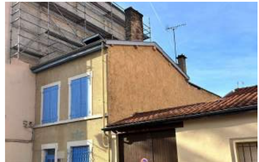
Fig. 2 - Muro divisorio in pisé, nel quartiere lionesse di Saint-Just.

In una recente intervista condotta dall'autore con Emmanuel Mille [24], architecte du patrimoine che si è lungamente occupato di questi temi, è emerso come, durante le sue ricerche, vi sia una forte correlazione tra mancato riconoscimento, scarsa conoscenza e percezione del bene. La visione comune dell'architettura in terra è quella di fragilità, anche dovuto ai numerosi crolli che si sono susseguiti, negli ultimi