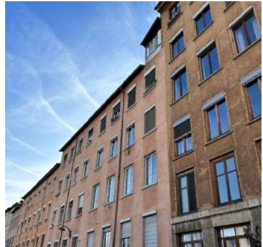
Fig. 4 - Edifici in pisé, nel quartiere lionese di Croix-Rousse.

studio operativo e attuativo per testare la validità e la replicabilità di tali direttrici. Le raccomandazioni finali della Declaration puntano soprattutto a questo: la promozione dei valori del patrimonio in terra, la massimizzazione dell'azione degli attori internazionali come UNESCO, ICOMOS o ICCROM, e la sinergia tra le istituzioni locali, “to prevent loss of heritage, improve education, and implement policies to promote the use of earth in building” [25]. È necessaria una responsabilizzazione, o meglio, una collaborazione con la cittadinanza, per disseminare la conoscenza sul patrimonio. L'adozione di queste linee guida è un percorso ancora aperto, oggetto di future ricerche, in cui la governance ed il framework normativo di questo patrimonio – ma estendibile anche ad altre architetture fragili – possano essere maggiormente definite ed ottimizzate attraverso paradigmi di gestione collaborativa.