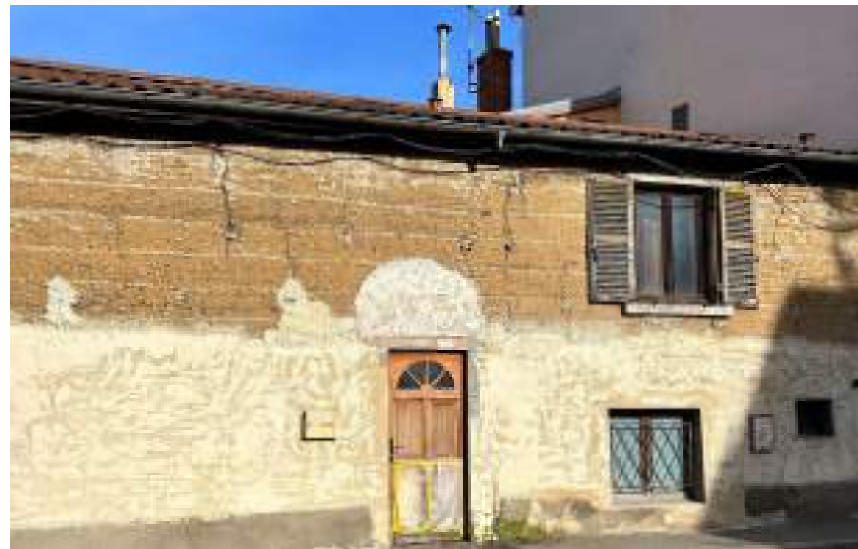
Fig. 3 - Edificio in stato di abbandono in pisé, nel quartiere lionese di Saint-Just.

La futura formulazione di linee guida non è elemento di novità a livello globale in un quadro di conservazione e valorizzazione dell'architettura in terra. La stessa conferenza Terra2016, ospitata a Lione, si è conclusa proprio con una dichiarazione, la Lyon Declaration [25], che conferma, da un lato, il riconoscimento delle architetture in terra nella città, e dall'altro sottolinea i problemi già noti sul mancato transfer di conoscenze per la cura e la salvaguardia degli edifici in pisé. L'adozione di linee guida già consolidate potrebbe portare alla mitigazione dei fattori di rischio elencati, e potrebbe essere un rilevante caso