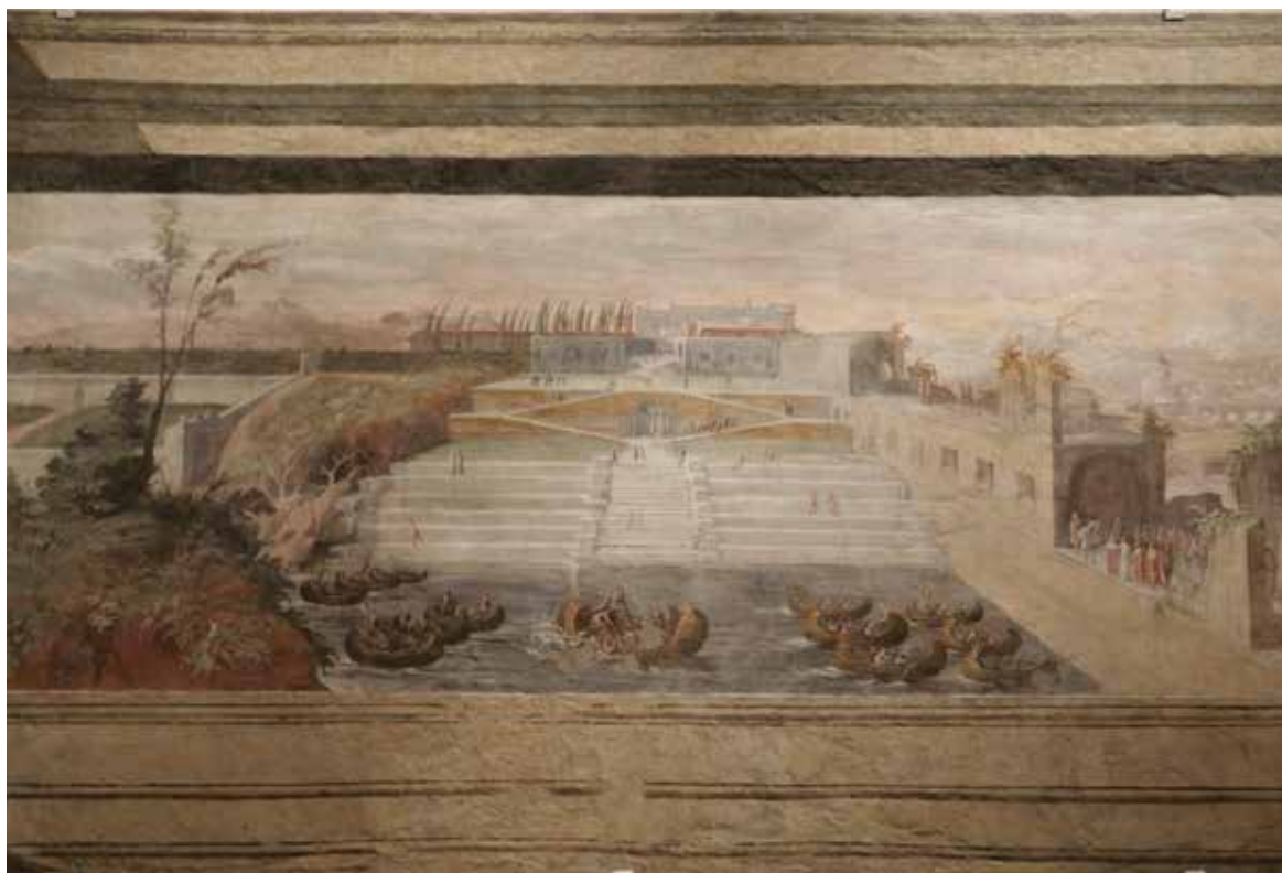
Fig. 5 - Perin del Vaga, Naumachia , Roma, Museo Nazionale di Castel Sant'Angelo.

Ligorio ha, però, restituito una rappresentazione verosimile della “iunca nave”, formalmente analoga alla “navichula” del f. 62v del ms. B. Il rapido schizzo del Libro XIII delinea un’armatura lignea, rivestita da stuoie, ai cui bordi sono applicati due scalmi e i relativi remi. L’umile ‘barchetta’ ricorda altresì le modeste imbarcazioni della Naumachia di Perin del Vaga (Fig. 5). Qui si raffigura un favoloso, quanto irrealistico, scontro navale inscenato in un immaginario bacino