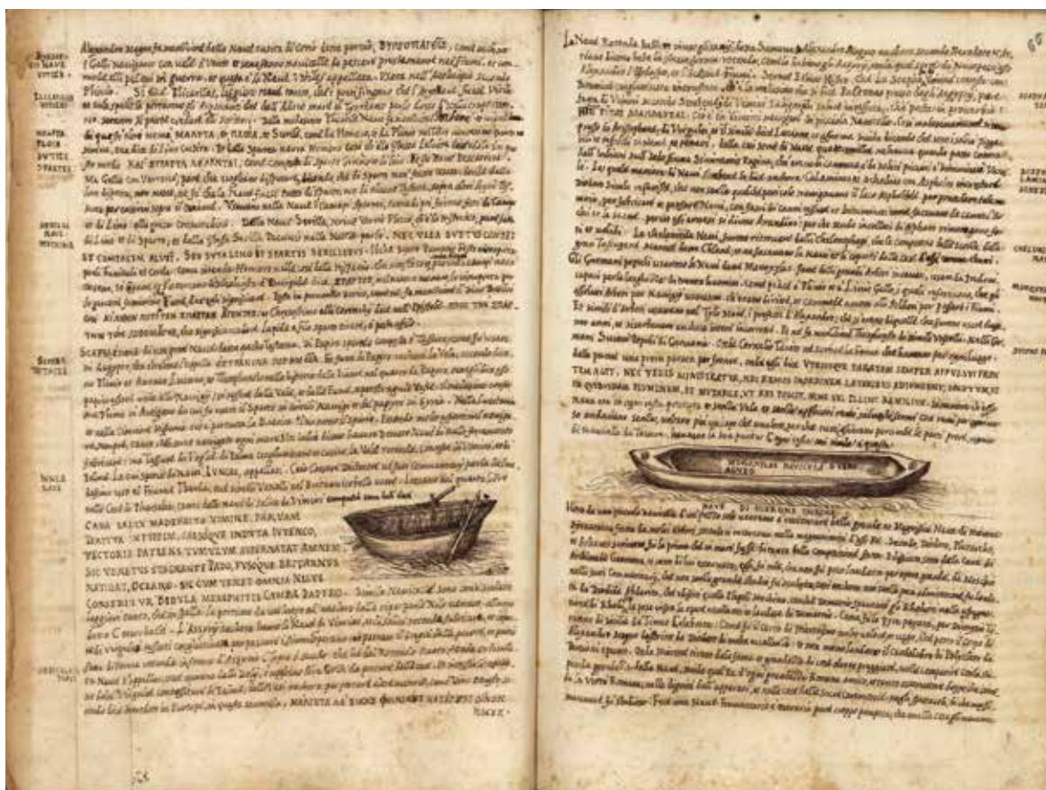
Fig. 4 - Navicella ligoriana, Torino, Archivio di Stato, Biblioteca Antica, Libro XIII.

“schedias”. Riaffiorano, qui come nel Ms. B, i passi del De bello civili di Lucano: