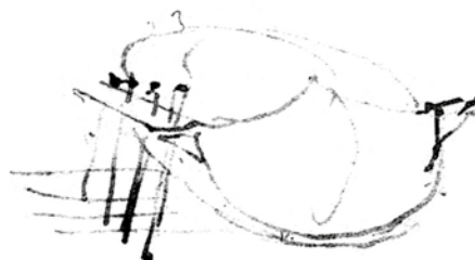
Ms B f. 97r