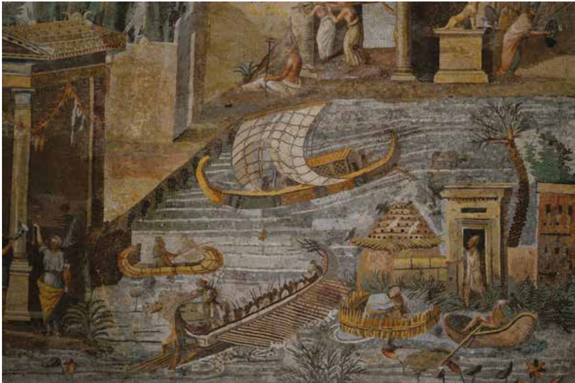
Fig. 2 – Mosaico nilotico, particolare, Palestrina, Museo Archeologico Nazionale di Palestrina.

tile era montata e, giunti all'arrembaggio, i combattenti si attaccavano a colpi di frecce spontali, frombe, coltelli ed altri strumenti marziali 13 .