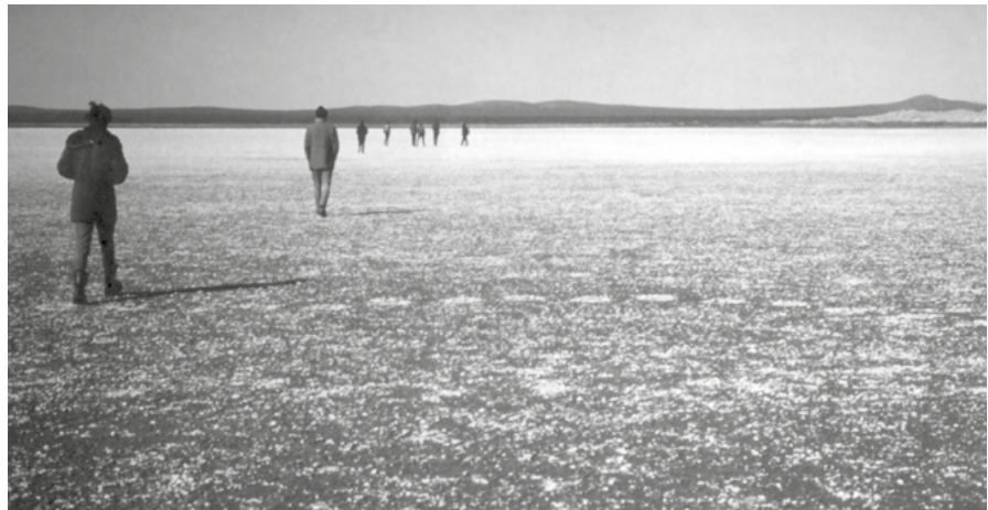
01. Prima Travesía. Viaggio alla scoperta del "mare interno" del continente americano | First Travesía. Journey to discover the "inland sea" of the American continent. 1965.