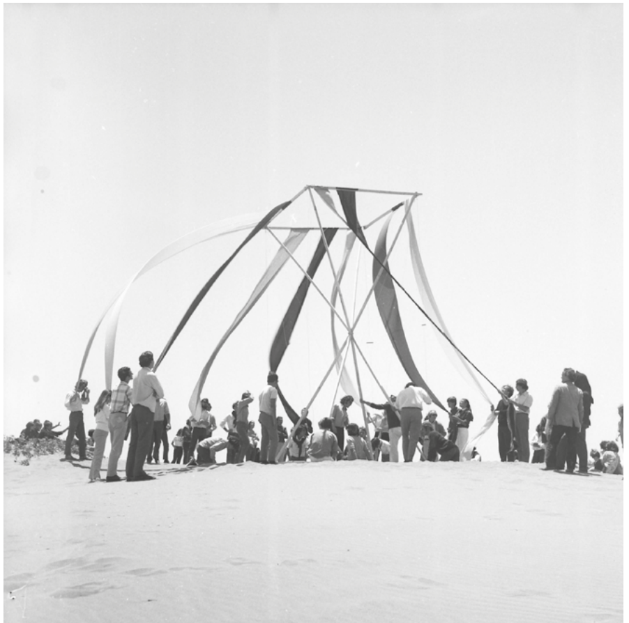
06. Ciudad Abierta, Atto di apertura poetica dei terreni | Ciudad Abierta, Act of poetic opening of the land. 1971.

In tal senso, la persistenza della Ciudad Abierta di Amereida – in quanto espressione materiale dinamica di un manifesto programmatico operativo che si ancora nelle relazioni che gli uomini e le donne stabiliscono con i loro territori – sembra offrire, soprattutto oggi, in mezzo al deserto dei meschini pensieri che travisano i concetti di identità e appartenenza a un luogo, una via altra per l'articolazione e la sintesi della contrapposizione dialettica tra diversi, tra ambienti e culture, tra architettura e vita.*