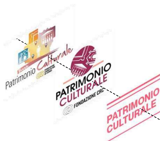
Fig. 1.1, Il bando Patrimonio Culturale dal 2016 al 2022.