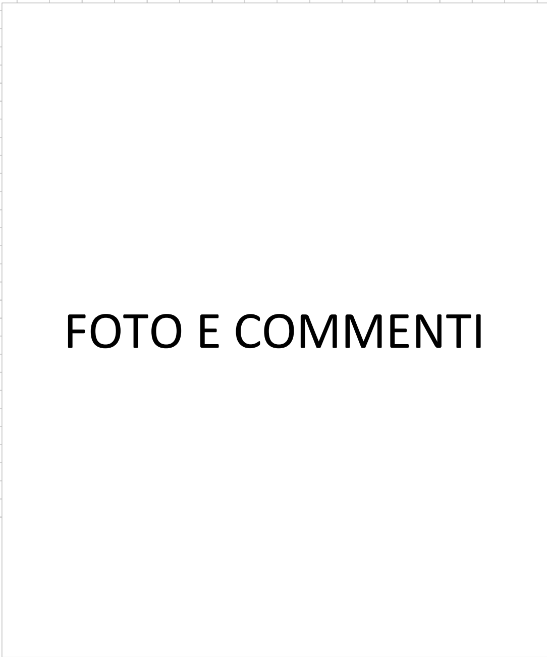
FOTO E COMMENTI

Il presente rapporto di prova non può essere utilizzato liberamente per scopi diversi da quello per cui è stato commissionato. Esso potrà quindi essere utilizzato per ottenere la dichiarazione di conformità ai sensi della UNI/PdR 90. Per ogni altro utilizzo/riproduzione del presente rapporto di prova dovrà essere richiesta l'autorizzazione scritta dell'ente preposto al test. Non è consentita la riproduzione parziale del rapporto di prova. Il rapporto si riferisce esclusivamente al materiale provato.