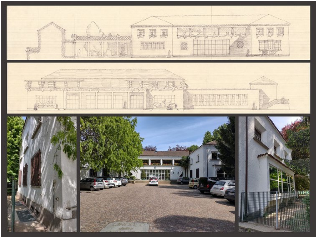
2: I prospetti della palazzina sociale, così come riportati nei progetti originari, a confronto con taluni scatti fotografici dello stato di fatto.

della grande industria» [Comoli 1983], si dà avvio a un esteso programma di sviluppo lungo le richiamate direttrici, ossia i prolungamenti del viale di Stupinigi e della strada di Orbassano, vale a dire il corso Agnelli sul quale oggi prospetta il complesso sportivo [Comoli, Viglino 1984, 89].