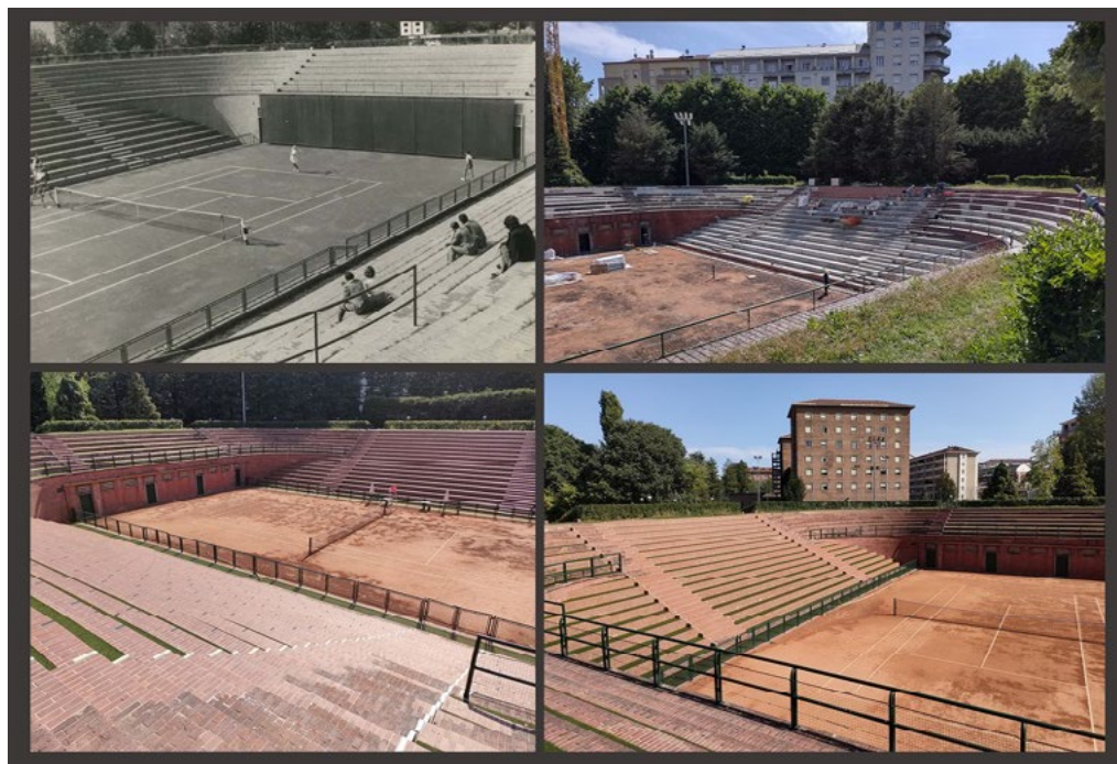
5: Lo stadio del tennis così come ripreso in uno scatto d'archivio a costruzione appena ultimata, in una fase dell'ultimo cantiere, e infine nello stato di fatto.

Il progetto della «palazzina sociale», al di là delle scelte stilistiche, è improntato sia alla funzionalità, sia alla perfetta rispondenza alle esigenze della vita appunto sociale, presentando una bella sala da pranzo, una sala delle feste, un soggiorno aperto su una loggia e un ampio locale bar (la «mescita»), ai due lati dell'ampio patio che fronteggia la piscina e l'ardito trampolino.