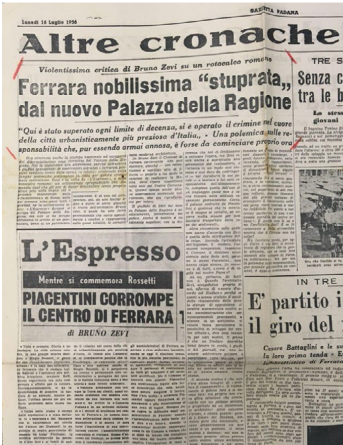
5: L'articolo di Zevi pubblicato sulla «Gazzetta Padana». [Ferrara nobilissima "stuprata" 1956]. BST UniFi, Piacentini, b. 240.

sollevando quindi l'amministrazione comunale comunista da ogni responsabilità, per la redazione della «Gazzetta Padana» è proprio il Comune a essere colpevole, per aver promosso – ormai quasi dieci anni prima – una «colossale svendita del centro urbano» [Ferrara nobilissima "stuprata" 1956] (Fig. 5).