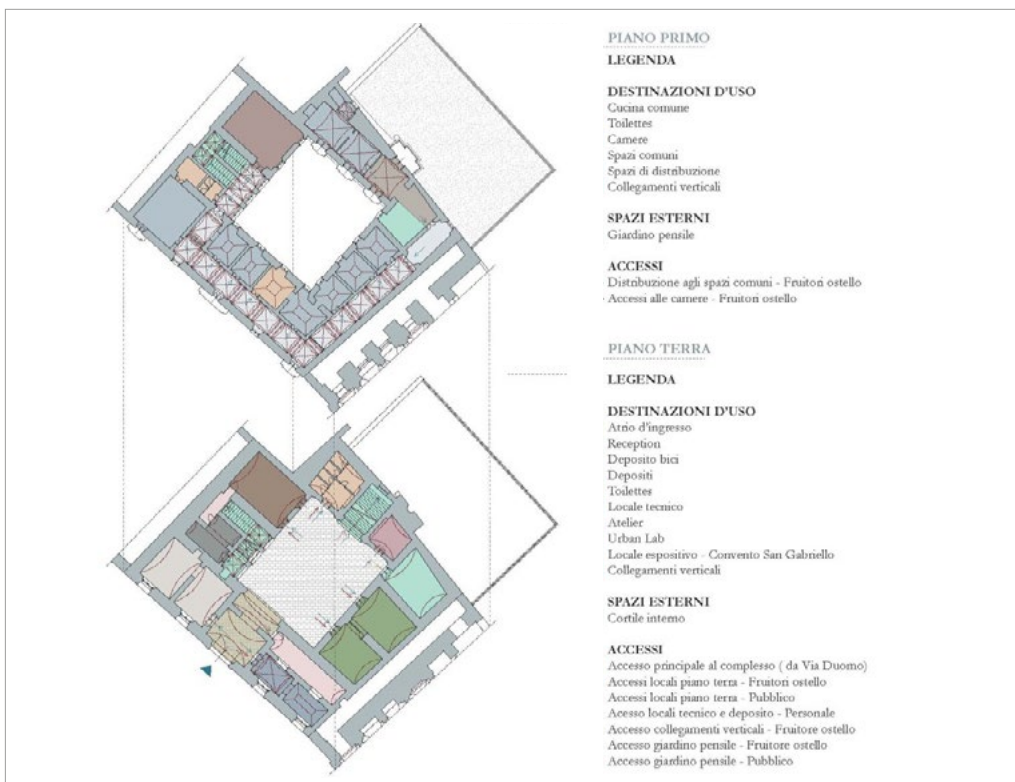
5: Ilaria Frusciante, Ex convento San Gabriello, planimetrie con ipotesi progettuali, 2022.