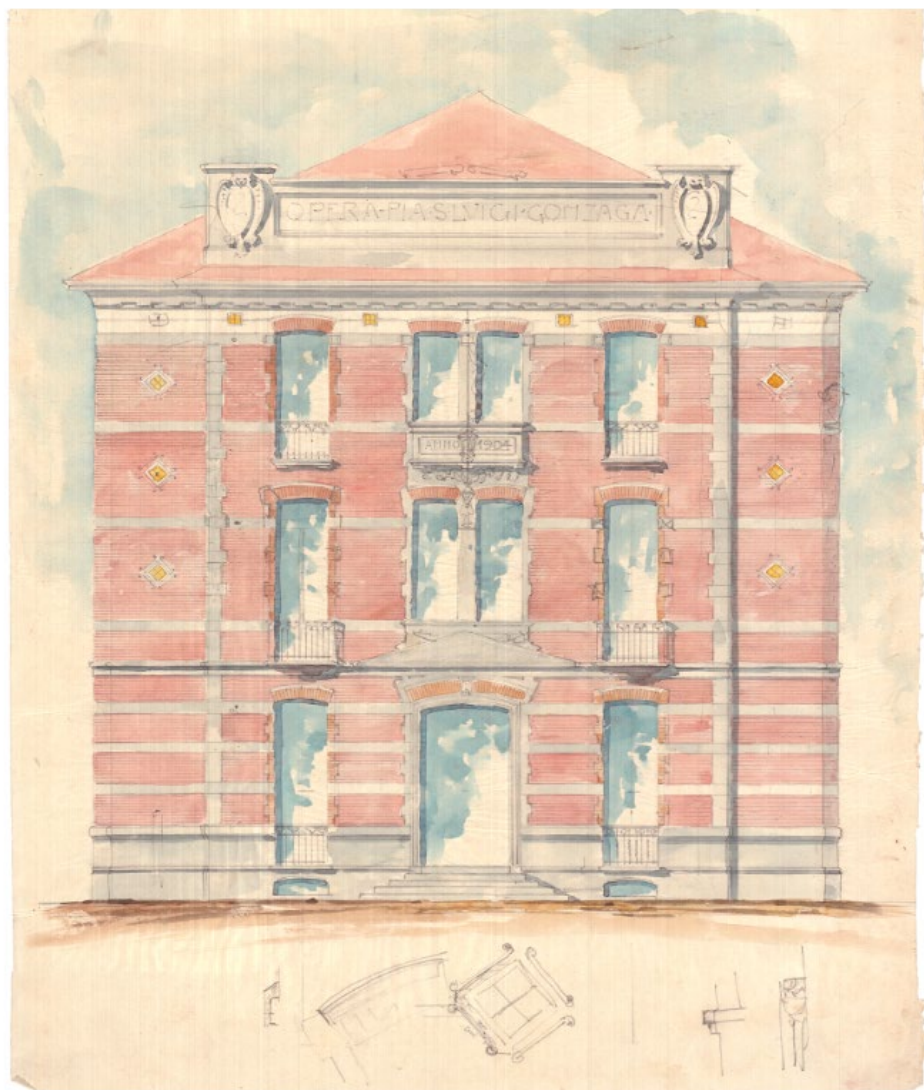
1: Eugenio Mollino, Opera San Luigi Gonzaga, disegno di una facciata tipo per l'espansione del nosocomio di via Santa Chiara, s.d. [1904]. Politecnico di Torino, sezione Archivi biblioteca Gabetti, Fondo Eugenio Mollino , cart. 6C_15.1904.

economico della Cassa di Risparmio di Torino 5 , per un trasferimento definitivo in un'area non urbanizzata, avviando la progettazione e la costruzione di un moderno e più ampio ospedale sanatoriale.