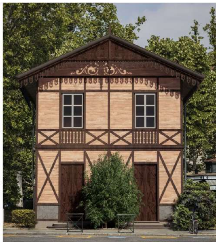
Figura 3 a. Ortofoto de una de las fachadas de Villino Caprifoglio antes de las obras de restauración (febrero de 2023). Figura 3 b. En la imagen izquierda la restitución gráfica de las obras de restauración en la misma elevación (octubre 2023). Imagen de los autores. Estudiantes, docentes y técnicos del Politécnico de Turín efectuando pruebas con la cámara termográfica en la fachada del palacio que se asoma al sur, otoño 2016.