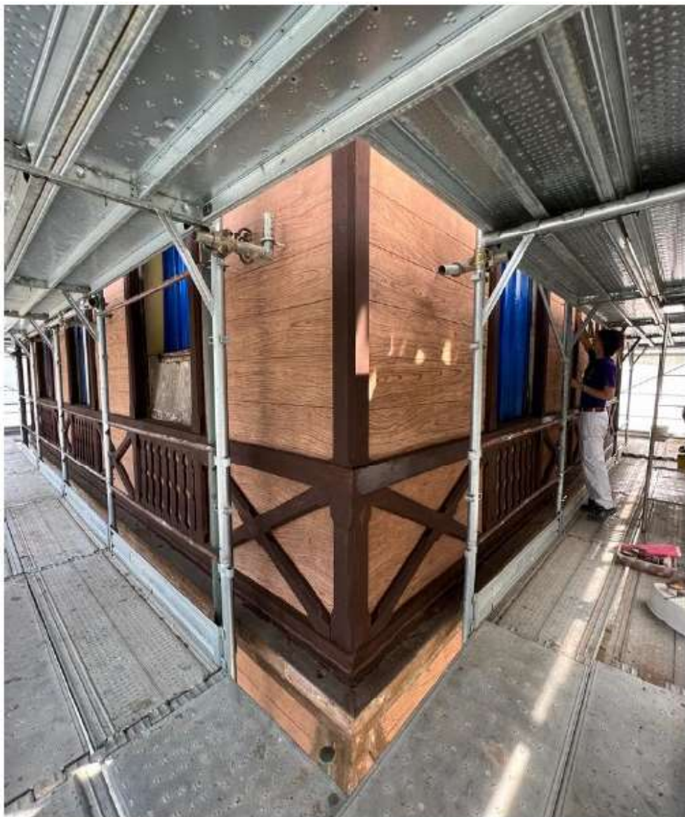
Figura 4. Fotografía de las obras de restauración de Villino Caprifoglio (septiembre de 2023).

nes que colaboran con las inserciones de madera para restituir la imagen de un chalet urbano y, por tanto, del aparato decorativo (Figuras 3b y 4). La intervención en los espacios interiores también consideró el carácter original de la obra: la distribución de las habitaciones no modificó y los colores de las paredes y marcos de ventanas fueron evaluados cuidadosamente en función de los ensayos realizados para garantizar la coherencia con el edificio preexistente.