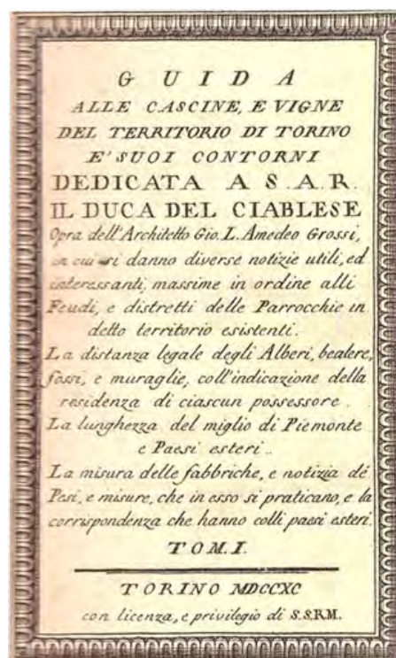
2: Giovanni Lorenzo Amedeo Grossi, Carta Corografica dimostrativa del territorio della città di Torino, luoghi e parti confinanti coll'annotazione precisa di tutti gli edifici civili, e rustici, loro denominazione, e titolo de' rispettivi attuali possessori de' medesimi, la designazione, e nome di tutte le strade, e delle principali bealere, e loro diramazioni, incisa da Pietro Amati e Pio Tela, 1790 e frontespizio della Guida.