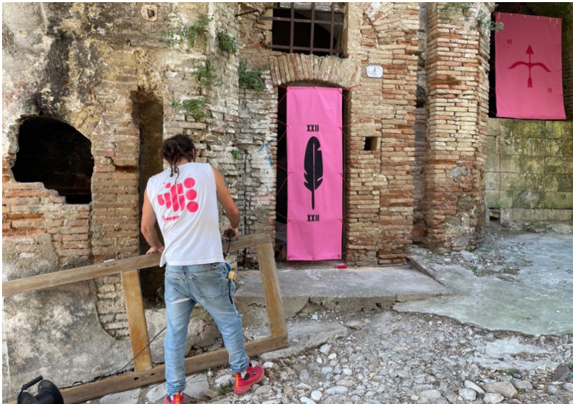
Fig. 5 La fotografia, scattata il 12/08/23, raffigura l'azione sulle soglie svolta a Pomarico.

idrogeologico, fattivamente a fronte di interessi economici e politici che hanno privilegiato la nuova costruzione al recupero dell'esistente. Un abbandono che nei più recenti decenni ha comportato pratiche predatorie delle abitazioni sino a giungere al diffuso uso dei piani terra come discariche a cielo aperto. Le "More" 6 hanno usato l'occasione del festival per delineare un progetto di attivazione civica e di lavoro culturale che andasse a destabilizzare questo equilibrio ormai consolidato: hanno deciso di darsi una forma giuridica, hanno avanzato richieste nei confronti dell'amministrazione comunale, ottenuto una sede proprio in una delle zone più problematiche del centro storico e lavorato con noi per giungere alla definizione condivisa di una prima azione performativa di trasformazione di questa parte di paese. Le soglie di quattordici abitazioni del centro storico che erano state divelte e gli interni utilizzati come discarica, sono state trasformate apponendo dei tessuti che rimandano al simbolismo generativo legato ad una tradizione ormai sopita di pratiche divinatorie e rituali. Un'azione capace di innescare una trasformazione e, a dispetto delle aspettative, restare ancora oggi – dopo diversi mesi – integra.