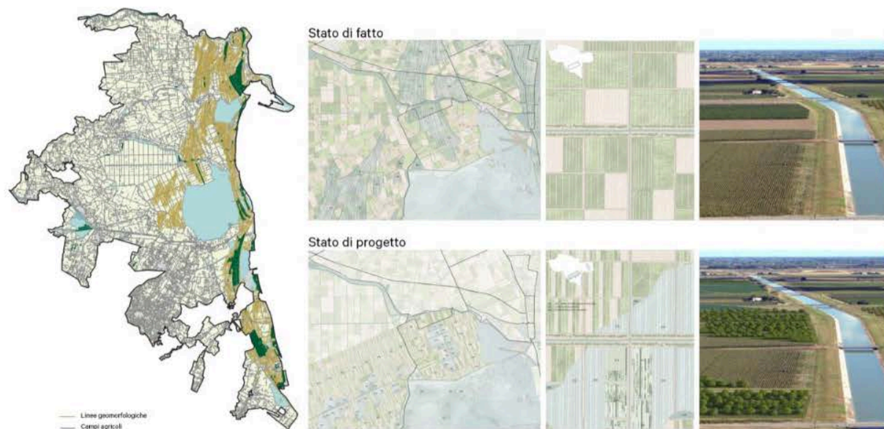
Figura 3 | Possibile localizzazione delle area di implementazione AFI, secondo la struttura geomorfologica del territorio. Sulla destra, un esempio di trasformazione del paesaggio agricolo a fronte dell'inserimento di nuove AFI.