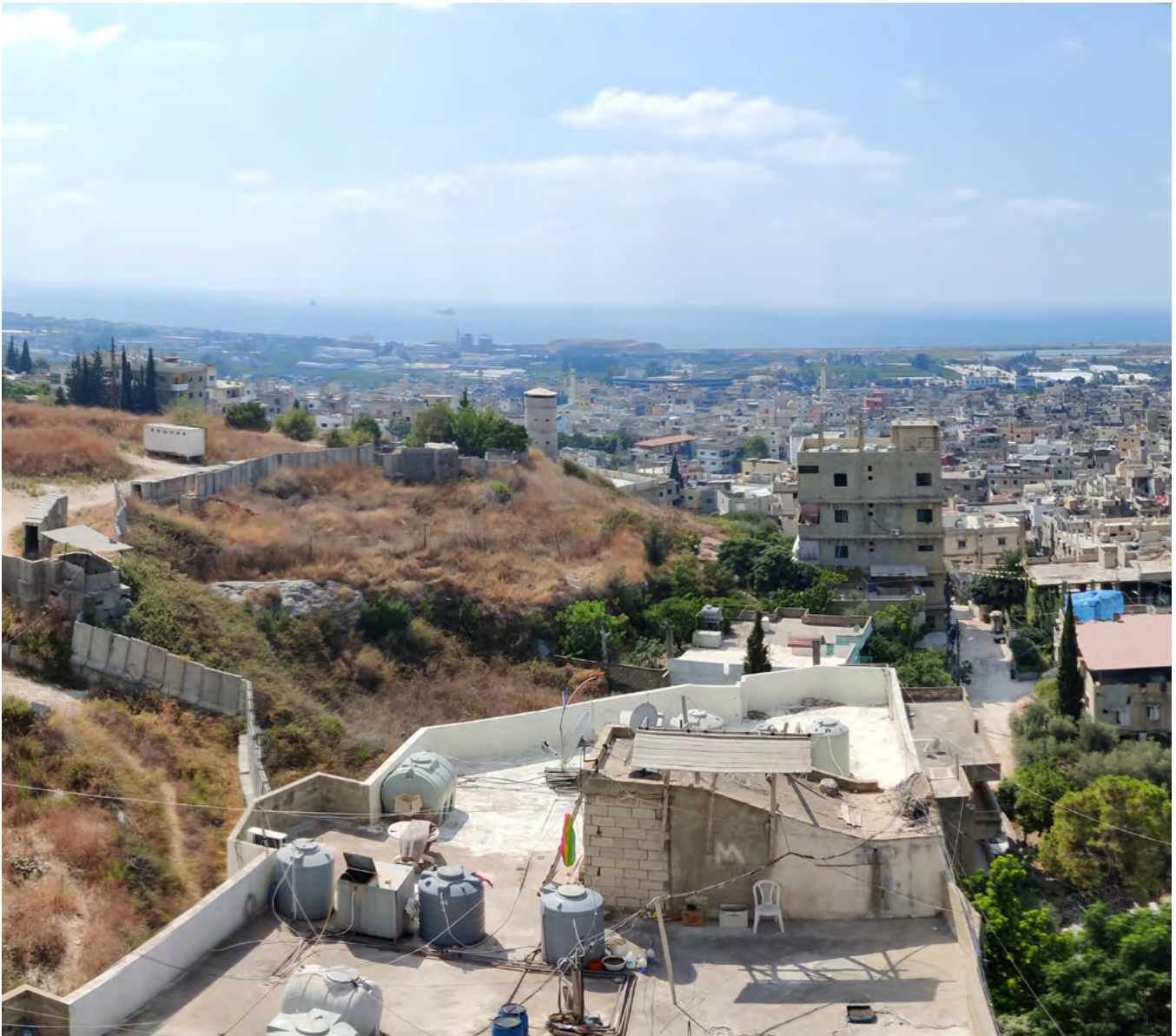
01. A view from Ein al-Hilweh showing the wall | Una vista da Ein al-Hilweh che mostra il muro. H. Samhan, August 2022