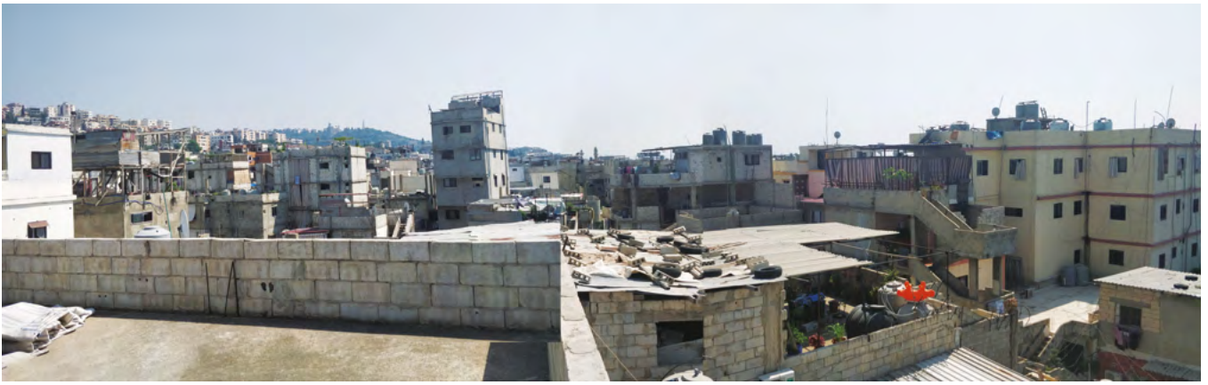
02. Ein al-Hilweh view | Vista di Ein al-Hilweh. Hanadi Samhan, Camillo Boano