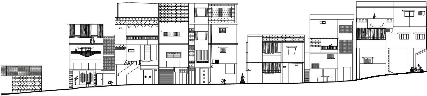
03. Ein al-Hilweh illustrative section | Sezione tipo di Ein al-Hilweh.

is debated in various contexts (Nethercote, 2018). For instance, Harris (2015) stressed the importance of studying ordinary high-rises for understanding social and political dimensions of urban verticality.