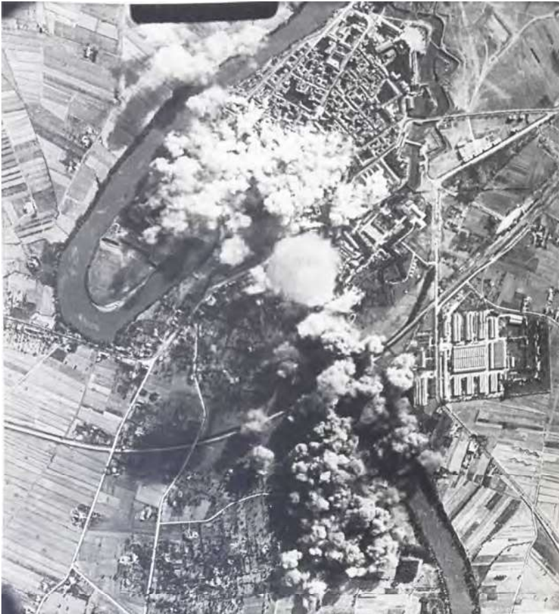
1: Bombardamento di Capua del 9 settembre 1943 [Angelone 2015, 102].