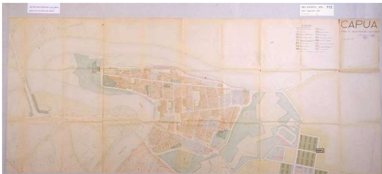
4: Piano di ricostruzione di Capua, 1947 (Archivio RAPu - DIC_g_112, QLC 1CE015 C1, Ministero dei lavori pubblici. Direzione generale del coordinamento territoriale).

Come è ben noto per far fronte alla tragica situazione che accomunava tante città italiane dilaniate dalla guerra, viene dichiarato l'obbligo per alcuni comuni di dotarsi di un piano di ricostruzione ai sensi del Decreto Luogotenenziale del 1° marzo 1945, n. 154, previa approvazione da parte del Ministero dei Lavori Pubblici. Tali piani, concepiti come una base per la redazione o revisione del piano regolatore alla fine della fase di emergenza, dovevano essere corredati da due planimetrie relative allo stato attuale e alla ricostruzione, in scala non inferiore a 1:2000, da una relazione e dalle norme edilizie [Serafini 2011].