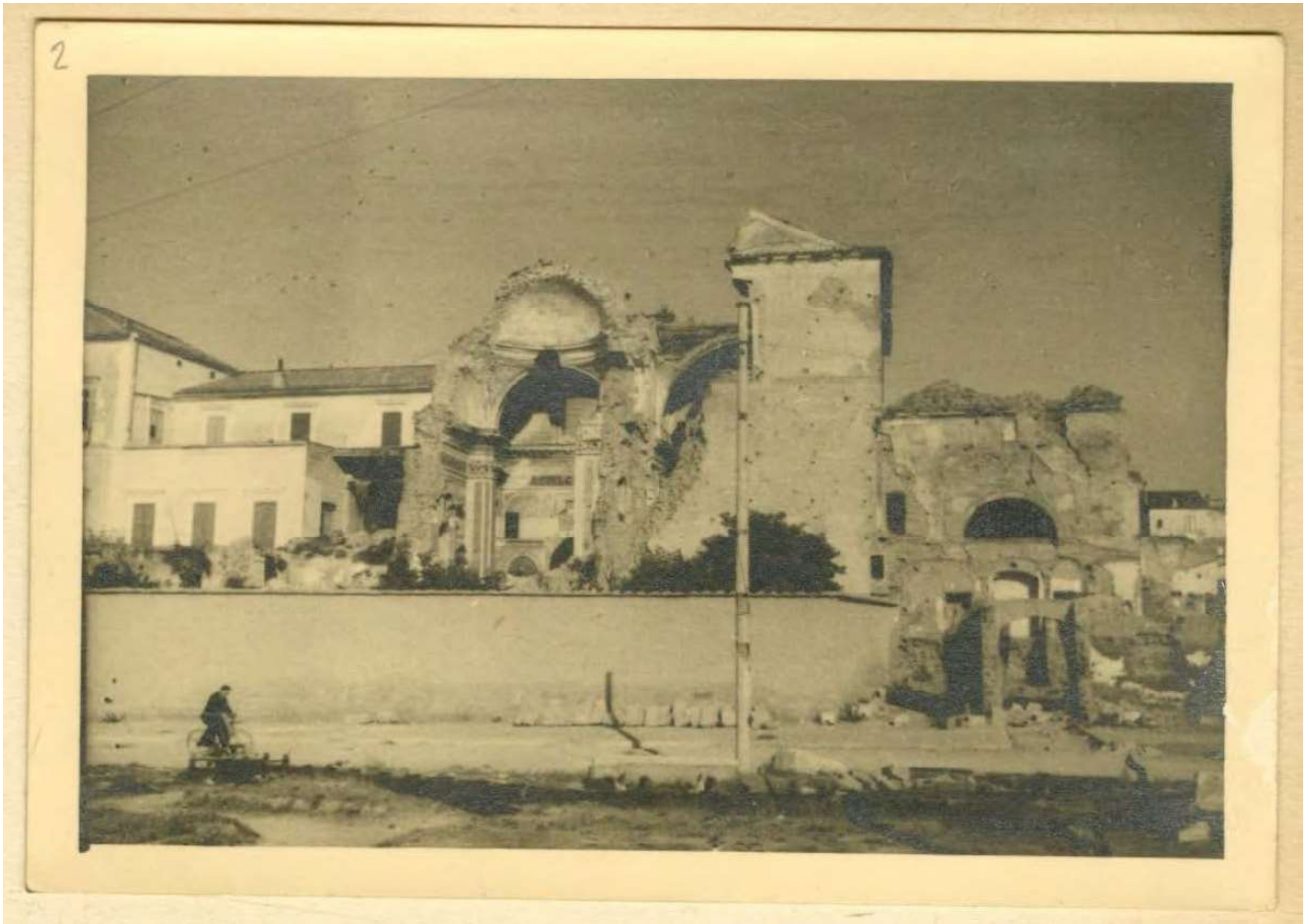
3: Veduta del Duomo dal lungo Volturmo, aprile 1948 (Roma, Archivio Centrale dello Stato, Ministero dei Lavori Pubblici, Direzione generale servizi speciali, Danni di guerra. Ripristino edifici attinenti al culto e alla beneficenza, B. 55, F. lo 52).

campano, la chiesa dell'Annunziata e un'altra chiesa individuata alle sue spalle – sul cui sedime sorge oggi piazza Medaglie d'Oro – la Chiesa di Sant'Angelo in Audoaldis, la Chiesa di San Giuseppe extra moenia , e tanti altri edifici sia civili che religiosi. Alle drammatiche condizioni del centro urbano, si uniscono i danni, pur se di minore entità, inferti alla zona ferroviaria 2 .