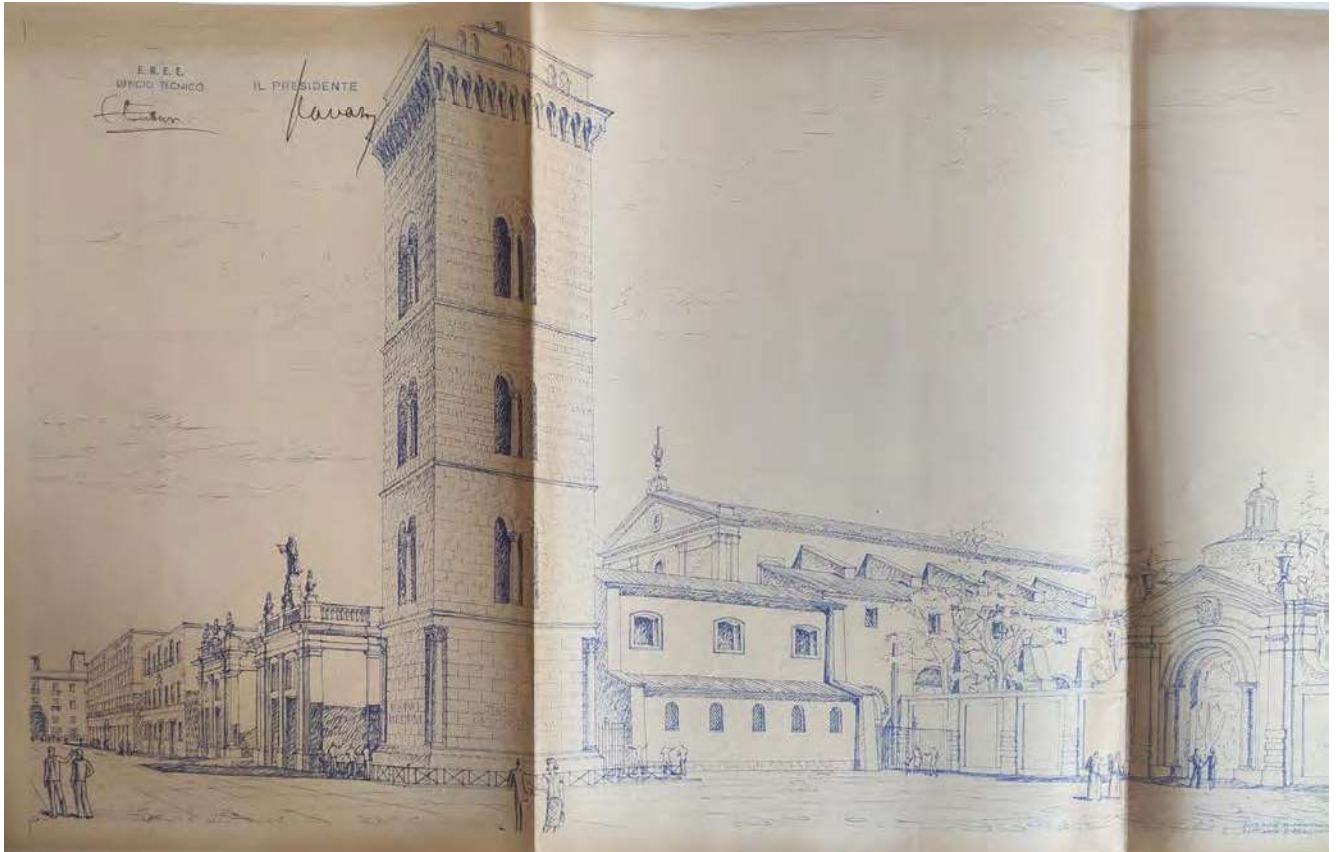
6: Sistemazione urbana relativa alla zona di piazza Duomo, a cura degli architetti Mario Paniconi e Giulio Pediconi (Roma, Archivio Centrale dello Stato, Ministero dei Lavori Pubblici, Direzione generale servizi speciali, Danni di guerra. Ripristino edifici attinenti al culto e alla beneficenza, B. 55, F. lo 52).

Varianti ai progetti per la zona di Porta Napoli e per la zona di Porta Fluviale sono attestate fino alla fine degli anni Cinquanta, mentre ulteriori lavori condotti dal Genio Civile si protraggono per tutti gli anni Settanta.