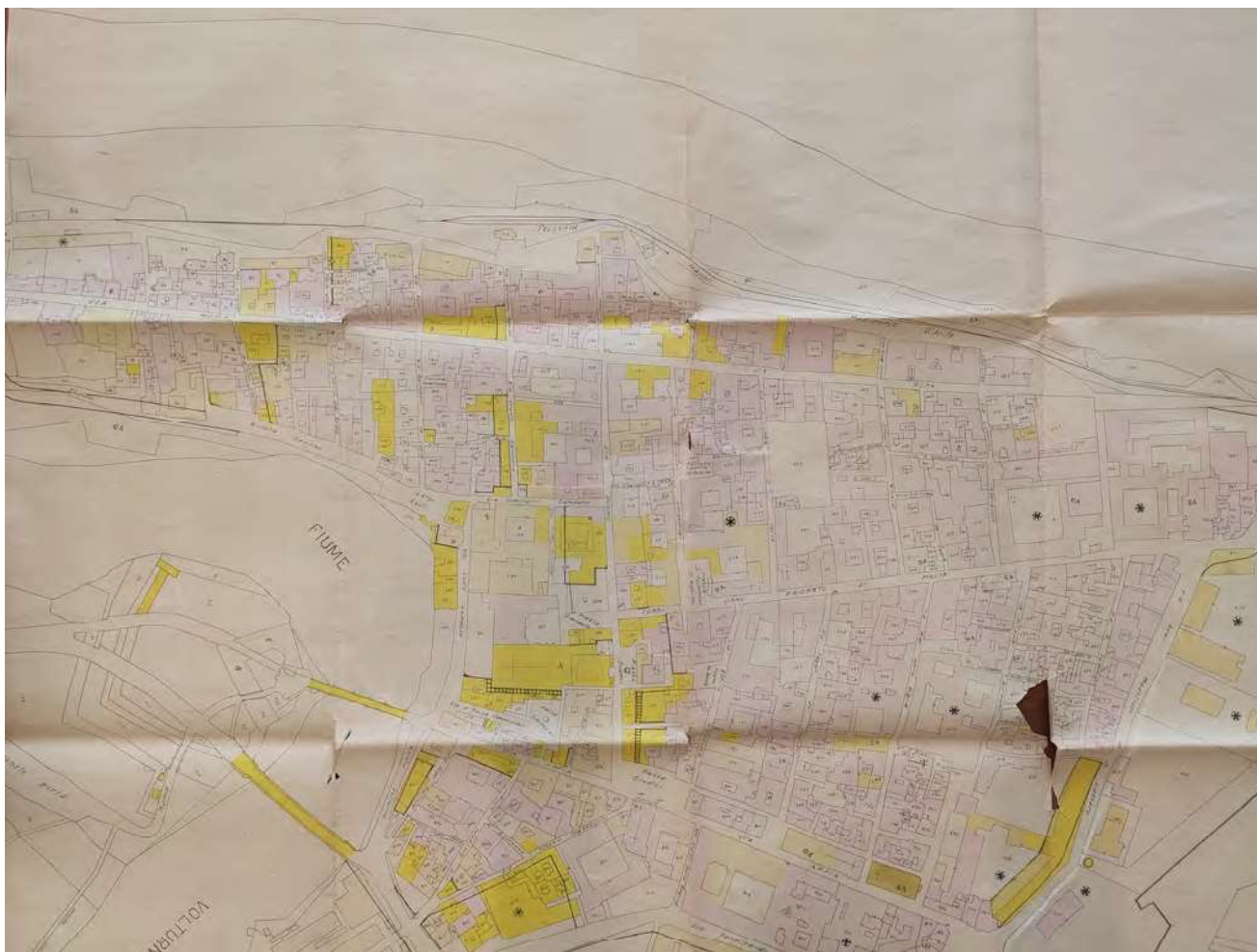
2: Stralcio della pianta relativa ai danni causati dai bombardamenti sul centro storico (Caserta, Archivio di Stato, Genio Civile, Cat. XI, B. 659, F.lo 2264, Stato attuale 2 del centro).

Com'è ben noto, nonostante la ricchezza del patrimonio cittadino, che aveva pochi eguali nel territorio della regione [Di Resta 1985; Cantone, Casiello 1987; Pane, Filangieri 1994], le maggiori attenzioni, compresi gli aiuti economici stanziati dagli alleati per i lavori di riparazione, furono rivolte al contesto napoletano. Solo quattro, infatti, sono i casi del territorio casertano annoverati nell'elenco dei lavori di riparazione stilato dal Soprintendente alle Gallerie Bruno Molajoli e dall'ufficiale statunitense Paul Gardner, nonché responsabile della Monuments, Fine Arts, and Archives Subcommittee in Campania [Molajoli, Gardner 1944]. Nello specifico, oltre al Palazzo Reale di Caserta e alla Cattedrale di Teano, figurano anche la Cattedrale di Capua e la vicina Abbazia di Sant'Angelo in Formis.