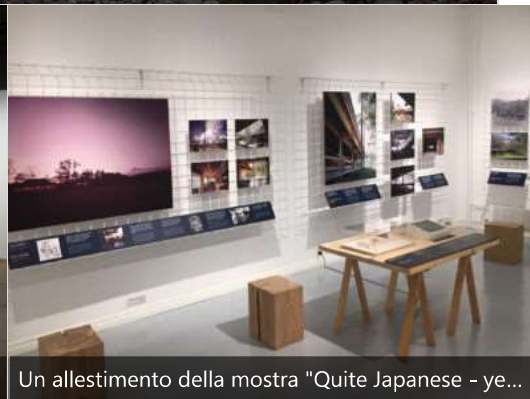
Un allestimento della mostra "Quite Japanese - ye...