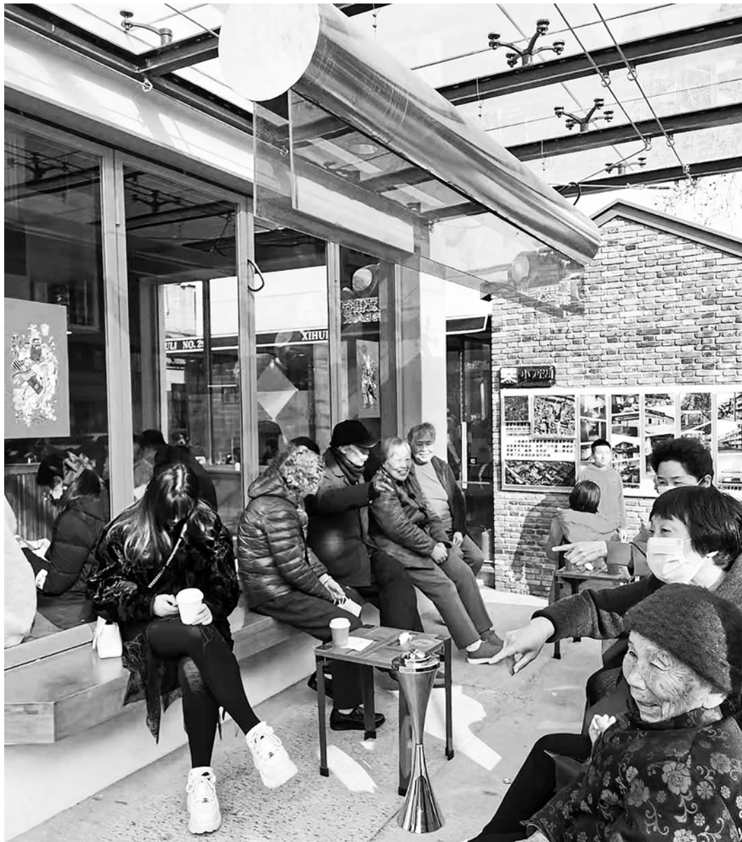
Fig. 8 - Nuovo spazio di relazione a XiaoXiHu.

ca, del tessuto edilizio e la classificazione attenta dei tipi e delle loro permutazioni nell'area. Restituire la topografia di XiaoXiHu è stato essenziale per avere un supporto al confronto con gli abitanti e i proprietari. Dapprima, la lettura tipo-morfologica ha consentito di isolare, a partire dai principi costruttivi, ogni fabbricato dal confinante, con un'azione simile al riconoscimento di ogni singola parola nella trama di un testo, in apparenza indecifrabile. Decisivo è stato poi ricostruire, per il tramite di mappe tipologiche aumentate , il gioco dei cambiamenti (permanenze e variazioni) dei regimi di proprietà, spesso con conseguenti variazioni di forme e di usi, con un'azione simile all'interpretazione diversa che nel tempo si può dare a ogni parola del testo decifrato.