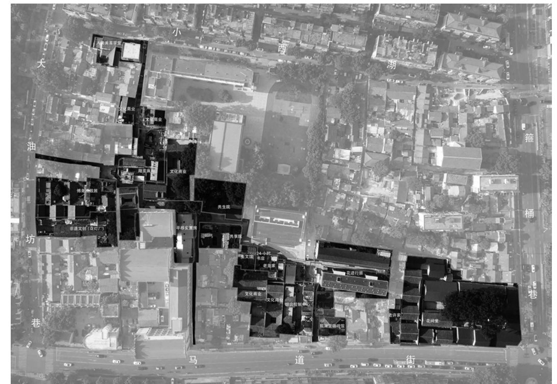
Fig. 2 - Foto aerea dell'isolato XiaoXiHu con gli interventi realizzati.