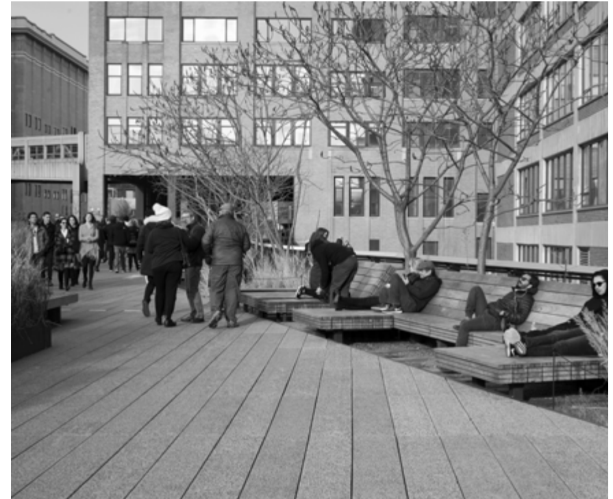
The High Line, Diller Scofidio + Renfro & Field Operations, Manhattan, New York

Protected Landscapes (IUCN Category V, CED PPN 2019) that protect recognized landscape resources (UNESCO heritage), essential for antifragile territorial development and for offering social and economic scenarios of proximity tourism in urban areas. In this perspective, local planning actions and projects should aim to protect biodiversity and enhance the ecological connectivity of territories, on the one hand, to respond to global challenges (such as the 30x30 target reiterated by the Kunming-Montreal Global Biodiversity Framework; COP 15, 2022) and, on the other hand, to contribute to the consolidation of alternative, integrated, and sustainable economic models (green economy, circular economy) and to effective, adaptive, and participatory management models. Additionally, it is necessary to consider the models and methods of the protected areas system and the green system capable of promoting and exporting "nature-conscious" design solutions (interventions for climate adaptation, carbon capture, reduction of natural disaster risk, decarbonization of the energy sector, and energy efficiency).