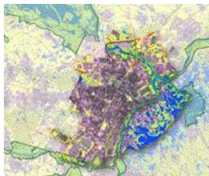
Il Parco del Po Piemontese per il progetto delle infrastrutture verdi e blu e per la reticolarità ecologica // Piedmont Po Park for green and blue infrastructure project and ecological networking