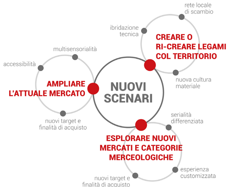
Fig. 3 - Sintesi visiva dei possibili nuovi scenari di intervento.