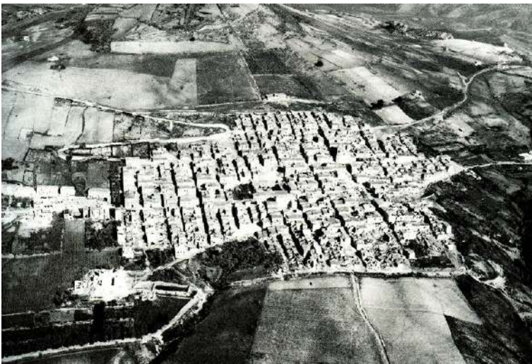
Fig. 2. Poggioreale antica, veduta aerea nel periodo successivo al sisma. Gli effetti principali della scossa sono evidenti nella parte più bassa dell'insediamento, al limite del contesto urbano.

interno da parte della nobiltà siciliana. Più precisamente, la sua fondazione risale al 17 maggio 1642, quando con decreto del viceré di Sicilia il marchese Morso ottenne la licentia populandi per fondare una città nuova nei pressi del feudo Bagnitelli, dove egli deteneva un palazzo-masseria adoperato per il diletto e per la caccia. La città, da piccolo centro agricolo, avrà un notevole sviluppo negli anni, tale da diventare un centro urbano definito nella sua conformazione territoriale e nelle strutture pubbliche presenti 6 . L'evento del 1968, una sequenza sismica che raggiunse il suo culmine