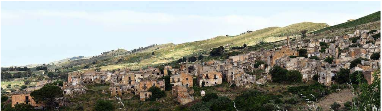
Fig. 1. I ruderi di Poggioreale antica oggi. Veduta da est.