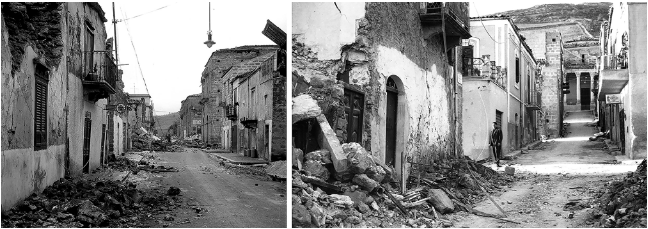
Fig. 3. Poggioreale all'indomani del sisma. Sono evidenti le macerie dei crolli, i quali interessavano solo limitate porzioni degli edifici.