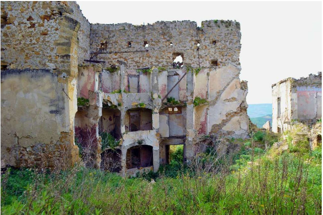
Fig. 6. Poggioreale antica: il teatro ottocentesco, un tempo accessibile dal corso principale della città.

destino di città ricostruite o abbandonate. I ruderi sono dunque rappresentazione di un evento che non rimane isolato nelle sue architetture, ma coinvolge la definizione di un territorio e l'evoluzione della sua comunità.