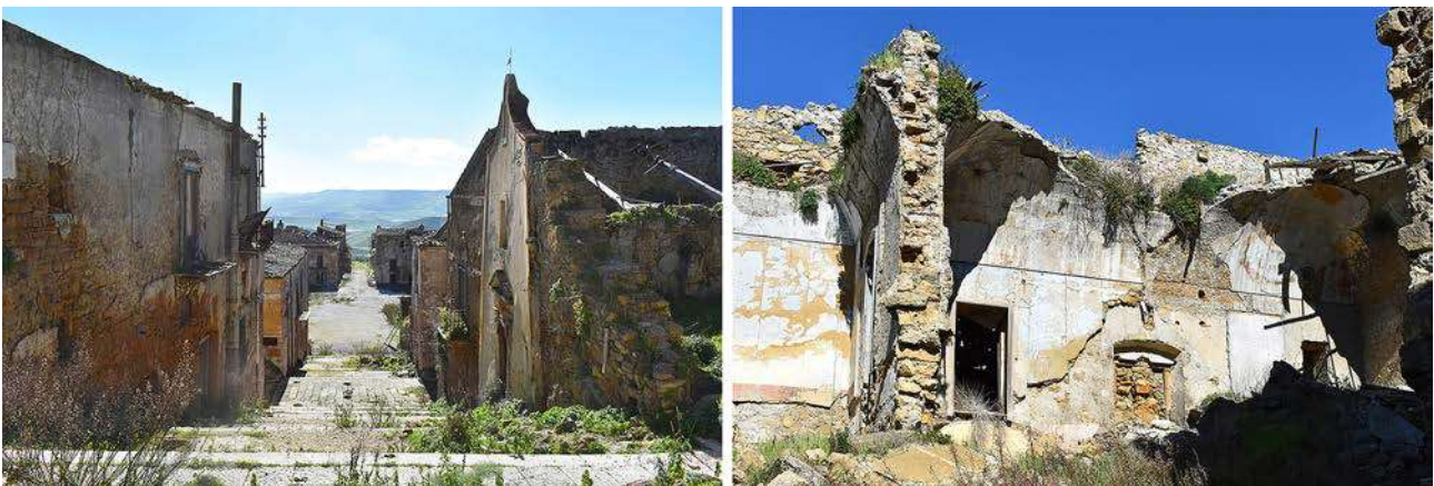
Fig. 4. Poggioreale antica oggi. A sinistra, vista dalla Matrice verso la Piazza; si noti la consistenza volumetrica degli isolati e la leggibilità del tessuto. A destra, un isolato segnato da crolli che ne evidenziano le sezioni murarie e delle volte.

sicurezza proposti per la conservazione fisica delle architetture superstiti hanno avuto il merito di far comprendere come questi non possano prescindere dal recupero della memoria immateriale del centro.