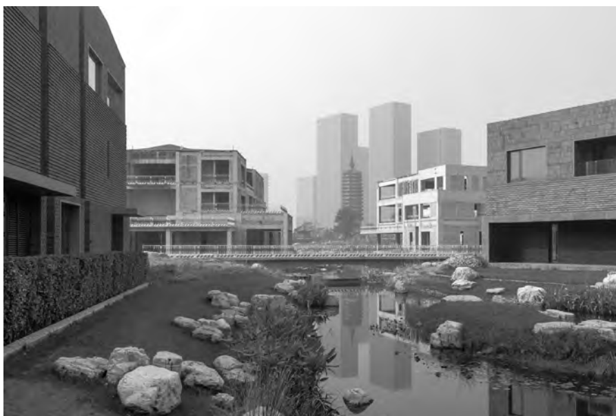
2. Villas under construction, Tongzhou New Town, Beijing 2017.

The third book is The City after Chinese New Towns: Spaces and Imaginaries from Contemporary Urban China edited by Michele Bonino, Francesca Governa, Maria Paola Repellino and Angelo Sampieri (2019). This book presents reflections on the important role that new towns,