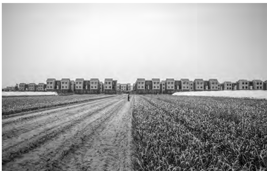
1. Tushandian New Agricultural Town, Central Plains of China 2019. Author: Leonardo Ramondetti.

In the case of the Central Plains of China, evidences for considering those territories as an enriched field can be found in spatial processes such as the construction of new infrastructural nets, housing complexes, and new production sites. The result is a general enrichment of the territory that is created and recreated by reciprocal differences between urban elements and the variety of spaces that make up the landscapes of central China. In particular, by hybridizing uses and spaces, the new production spaces become huge creative clusters exalting advances in technology, art, and culture, and resulting into the enrichment of the everyday experience. These different