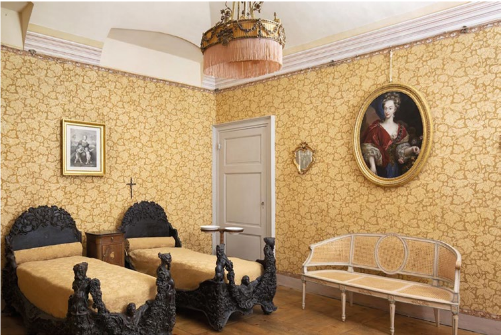
5: Stanza della principessa Maria Clotilde (Silvia Beltramo).

prevedeva uno spostamento in ferrovia fino a Fossano, e da qui a San Michele Mondovì in vetture di diverso tipo; una char a baldacchino tirata da 4 cavalli per i principi e per il generale, un calesse di traghetti a due cavalli d'affitto per il dottore e il precettore, un furgoncino alla polacca e un omnibus per il resto della comitiva, come ricordato nel fascicolo che racchiude la documentazione inerente alla partenza della corte dei principi e delle principesse per Casotto 14 .