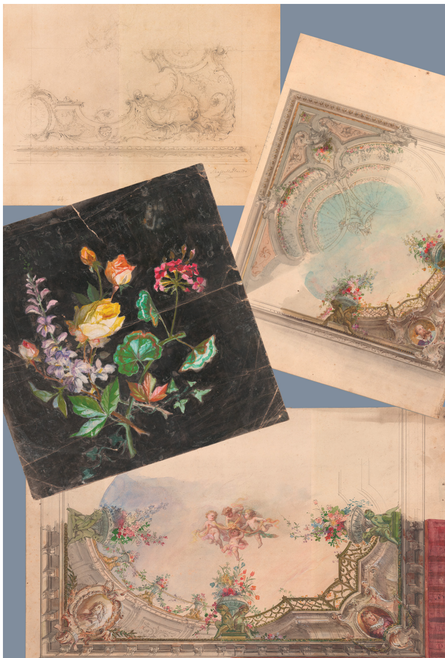
Fig. 3_Alcuni bozzetti firmati da Placido Mossello (DIST-APRi).