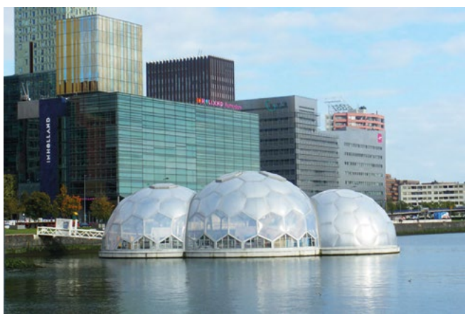
Figura 4. Floating Pavillon, Rotterdam. Da: https://inhabitat.com/rotterdam-floating-pavillon-is-an-experimental-climate-proof-development/ .