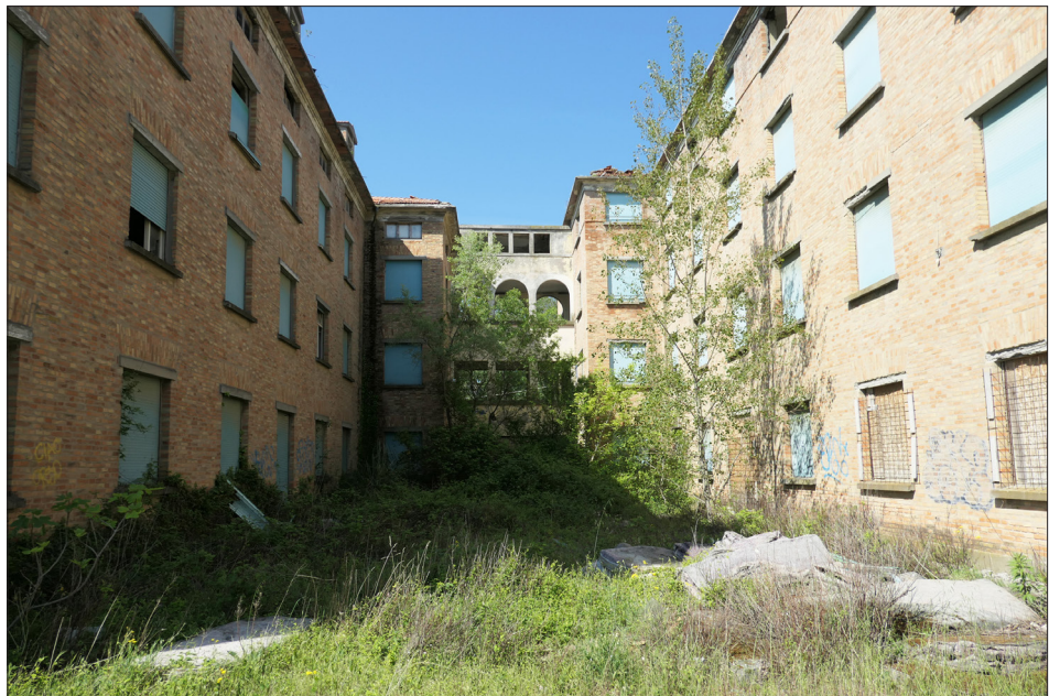
Fig. 9a. La colonia marina 12 Stelle, proprietà della Caritas/Diocesi di Bolzano-Bressanone, Cesenatico.