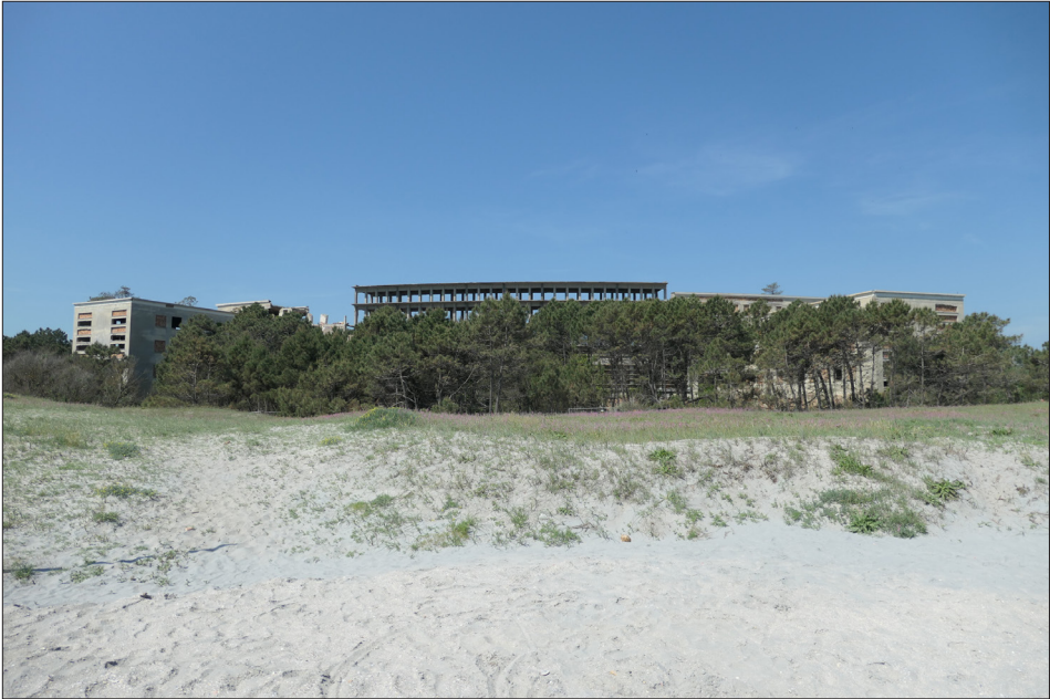
Fig. 1. L'ex-colonia Varese a Milano Marittima [foto Sofia Nannini, 2022].

restauro e il riuso di questo patrimonio, ma intende presentare una lettura panoramica, necessariamente non esaustiva, delle tracce materiali legate al fenomeno delle colonie per l'infanzia in Italia. Il testo si concentra su due categorie di ex colonie per l'infanzia: le grandi strutture costruite durante il regime fascista e le tante e diffuse costruzioni edificate nel secondo dopoguerra 2 .