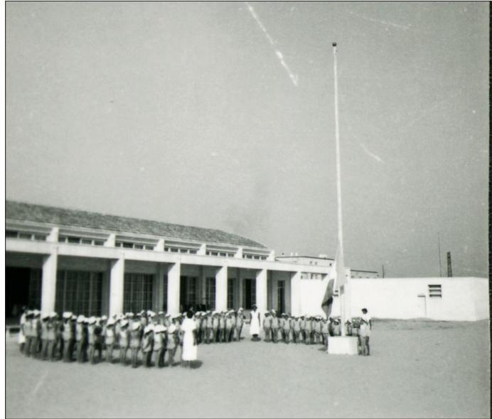
Fig. 7. Colonia marina Sacra Famiglia, Igea Marina, 1952 circa, Gioventù italiana, Commissariato provinciale di Bologna [Istituto storico Parri, Bologna, Fondo Gioventù italiana, A.7.18, 2/126].