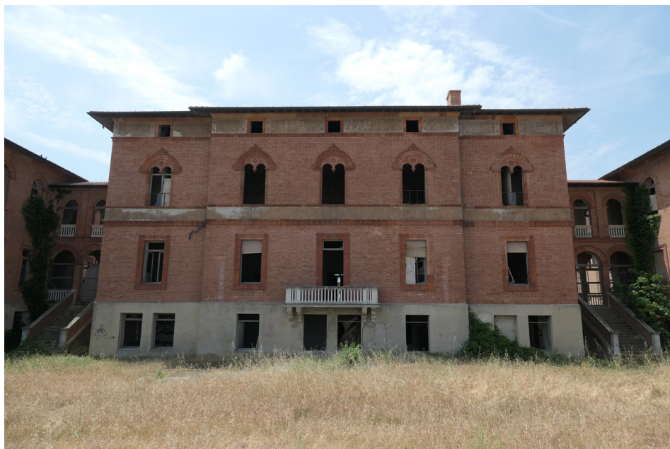
Fig. 13. L'ex-colonia Bolognese, Miramare di Rimini.