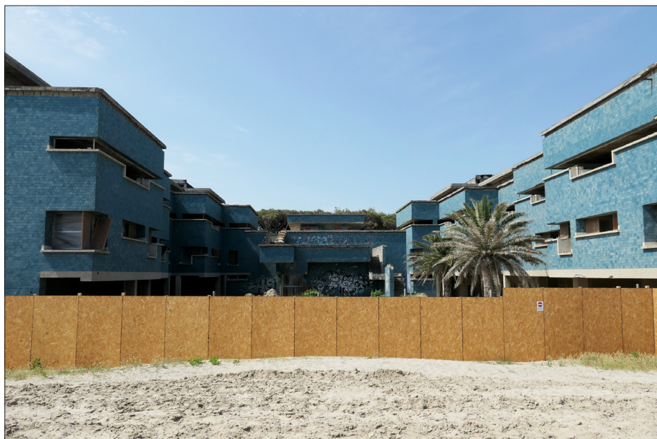
Fig. 10a. Colonia Enpas, Cesenatico [foto Sofia Nannini, 2022].