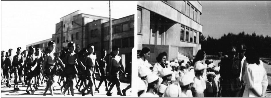
Fig. 2. Bambini figli di coloni italiani in Libia presso la Colonia Gil a Marina di Ravenna, estate 1942.

Italia [Arthurs 2010; Hökerberg 2018; Carter, Martin 2019; Belmonte 2019; Bartolini 2020; Albanese, Ceci 2022].