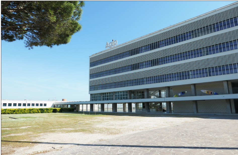
Fig. 5. La colonia marina Agip a Cesenatico, progetto di Giuseppe Vaccaro, 1937-39.

allude in modo evidente ad un immaginario militare. Un esempio celebre è l'ex colonia per figli d'italiani all'estero (XXVIII Ottobre) presso Cattolica. Progetto di Clemente Busiri Vici, inaugurata nel 1934, la struttura si compone di quattro dormitori posizionati simmetricamente rispetto al padiglione centrale, richiamando l'immagine di navi corazzate pronte per salpare verso l'Adriatico [Dalmonte 2007; Dalmonte 2013].