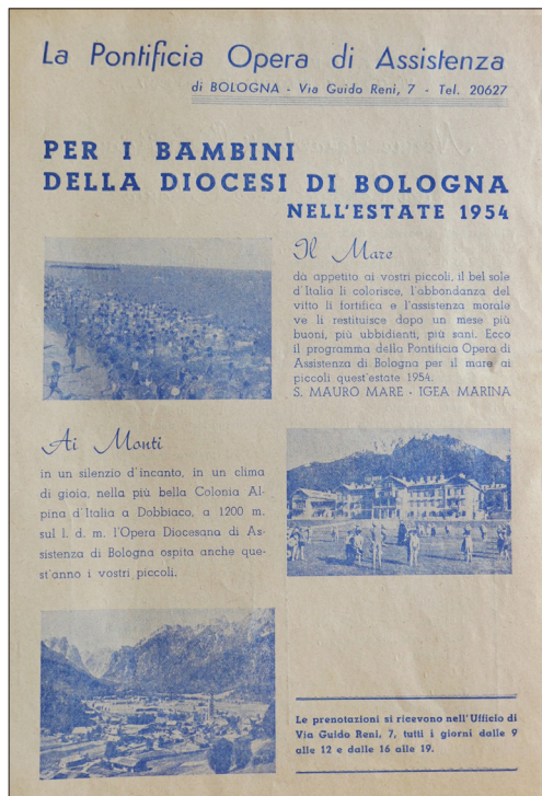
Fig. 8. Opuscolo della Pontificia opera di assistenza, Diocesi di Bologna, 1954 [Archivio storico della Regione Emilia-Romagna, Fondo Gioventù italiana, Assistenza estiva, b. 25].

di proprietà del comando di Bologna della Gioventù italiana del littorio, nota come colonia Costanzo Ciano 13 .