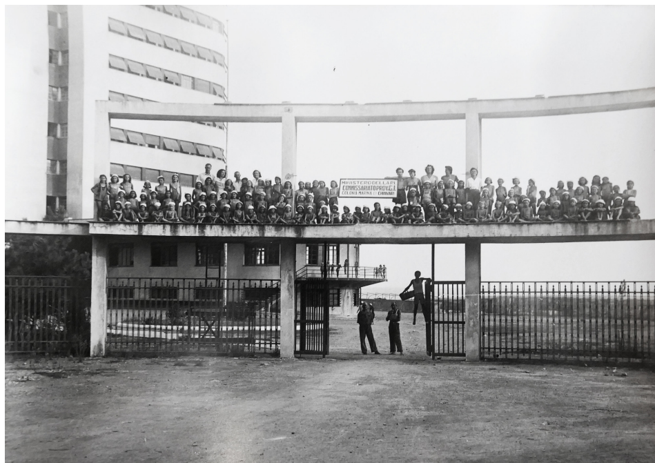
Fig. 3. Colonia marina Fara a Chiavari, Commissariato provinciale della gioventù italiana di Bologna, estate 1946 [Archivio storico della Regione Emilia-Romagna, Fondo Gioventù italiana, Assistenza, b. 10].

una buona parte delle colonie della Gioventù italiana alla Pontificia commissione per una durata di cinque anni. Tramite la stipula di contratti di affitto, la gestione pontificia delle tante ex colonie fasciste – attraverso l’attività delle Sezioni diocesane di assistenza – prosegue per tutti gli anni Sessanta, nonostante le numerose proteste da parte di giornalisti e osservatori politici [Falconi 1956; Orsello 1956; Garofalo 1957; Falconi 1957].