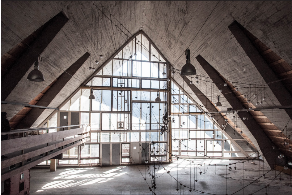
Fig. 11. L'ex colonia Eni a Borca di Cadore.

Lungo le coste o in vallate alpine, le tante ex colonie del secondo dopoguerra sono il segno tangibile dell'attività antropica sul paesaggio, frutto del boom edilizio del Novecento di cui oggi ereditiamo le giovani rovine. Lo studio di questi edifici è un modo per comprendere come la società contemporanea sia in grado di porsi nei confronti del patrimonio del boom economico – un patrimonio relativamente recente e che tuttavia sembra giungere a noi da una preistoria lontana, già in forma archeologica.