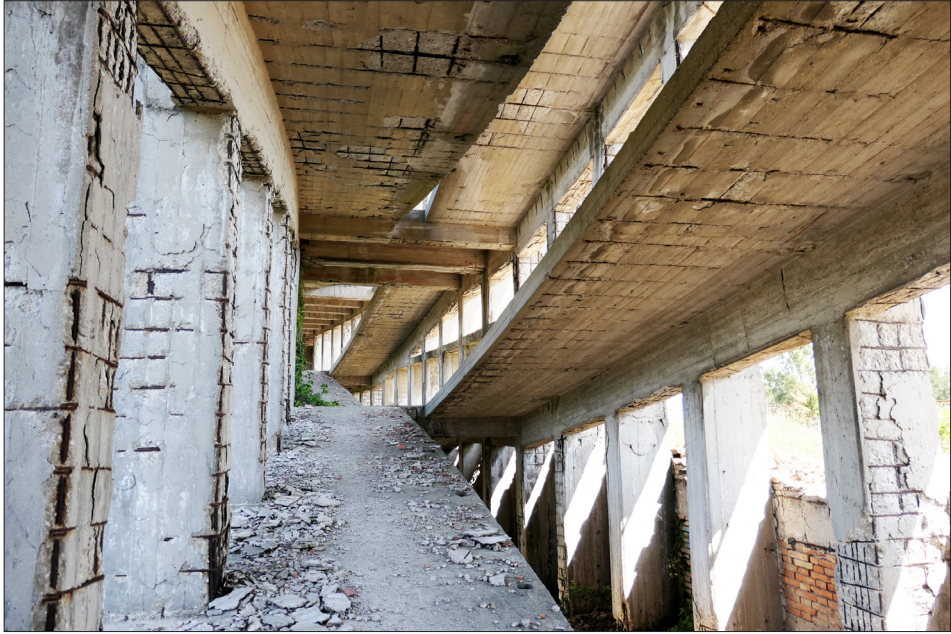
Fig. 6. Il precario stato della colonia Varese a Milano Marittima.

no alterato la simmetria, l'operazione più complessa ha riguardato la già citata colonia per i figli d'italiani all'estero di Cattolica, convertita in acquario nel 2000. Nonostante l'interesse di lunga data nei confronti della conservazione di queste strutture [Canali 2005; Canali, Galati 2005], i casi di abbandono e fragilità strutturale delle ex colonie sono ancora tanti. Nell'estate del 2020, una porzione delle rampe in cemento armato della colonia Varese è crollata, suscitando un dibattito sulla sicurezza dell'edificio [Madiotto, Selmi 2021].